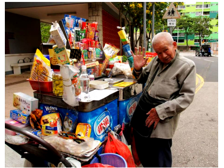
雪糕老伯樂觀健談，五十年來人緣甚好

我想跟大家分享從電視節目看到的一個小小的故事，但我想先向大家提出一個問題：究竟我們為了甚麼而工作？除了睡覺，工作是我們人生中的主要部份，當然，工作不取「成人幹活謀生」的狹義，而是跨越各年齡階層及社會階級的「職份」，於學生是攻書求學，於母親是照顧家庭和子女，於藝術家則是創作各種發人深省的藝術品。可見工作幾近是我們每位的「生活」與「人生」，再深推想，我們因何而活？