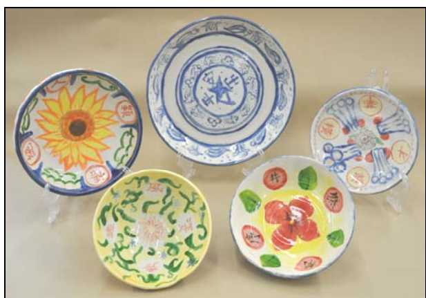
(左起) 1B 譚皓穎、1D 吳穎姿、1C 林芳瑜、 1A 關皓然及 1D 鄧倩華同學的陶瓷彩繪作品