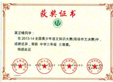
現場作文決賽三等獎