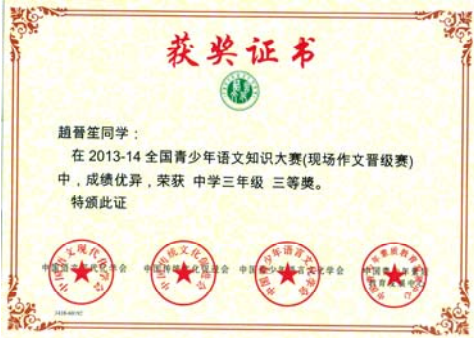
現場作文晉級賽三等獎