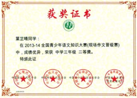
現場作文晉級賽二等獎