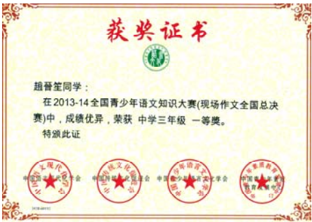
現場作文全國總決賽一等獎