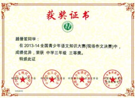
現場作文全國三等獎