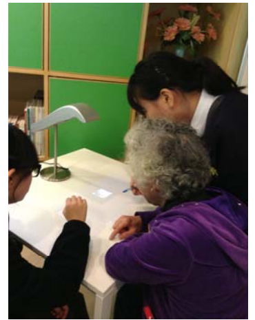
團員利用自己電腦的知識，協助長者學習新科技

本校 11 名中四同學自 2014 年 11 月便開始參與由義務工作發展局舉辦之「4C 青年義工領袖團，4C 的四個 C 字代表：Confidence 自信、Care 關懷、Commitment 承擔、Courage 勇氣，計劃透過義工培訓及服務參與，建立青年義工領袖的 4C 素質，本年度他們參與多項訓練項目，當中包括：4C 青年義工領袖團迎新日、4C 青年義工領袖計劃培訓營、4C 青年義工領袖進階培訓及 4C 青年義工領袖計劃聯校畢業營。本領袖團在本年度參與了區內「樂聚松明長者友善社區」巡禮攤位活動及教導長者使用平板電腦，以下為部分團員參與服務後的心聲：