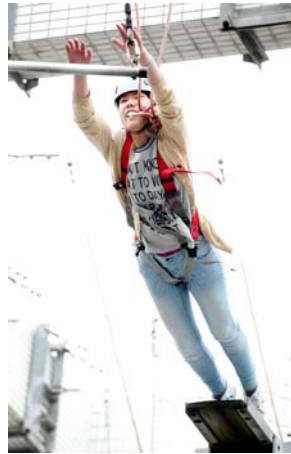
團員於「城市之峰」進行義工領袖進階培訓