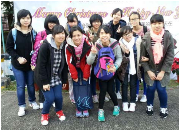
團員於烏溪沙青年新村參與青年義工領袖計劃培訓營