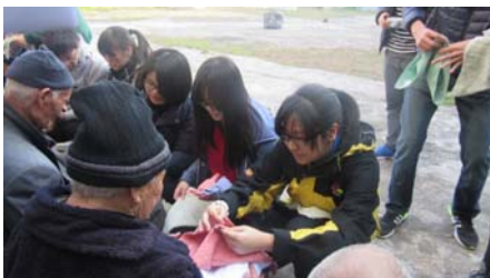
本校學生為清遠居民即場製作小禮物，以表心意