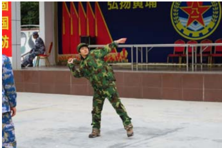
培訓營除了培養學生的紀律，同時讓學生體驗軍事文化，圖為學生練習投擲