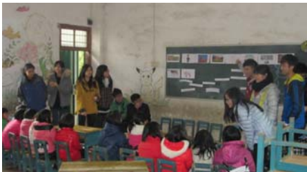
本校學生於清遠當地小學義教