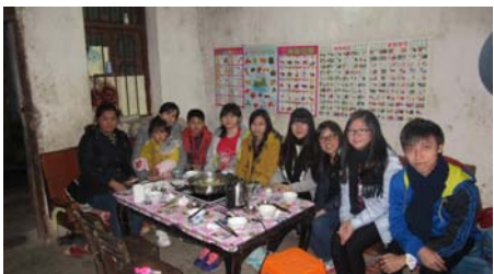
本校學生走訪清遠家庭，深入了解居民生活情況