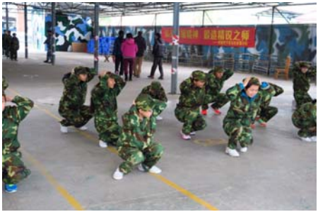
訓練營採用集體訓練方式，讓學生從中培養團隊精神