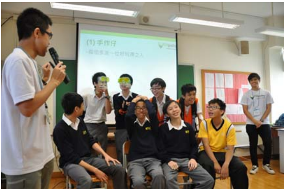
輔導組為學生舉辦德育講座及工作坊，培養學生的品德情意