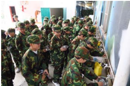
培訓營強調自律及自理，學生需於餐前一手包辦餐具佈置，飯後亦需要自行收拾及清理餐具

為提升中一級學生的紀律、自理能力及培養同學的團隊精神，本校每年均會舉辦培訓營，讓中一級全體學生前往惠州黃埔軍校接受訓練。中五級學生則兵分兩路，5A、5B、5D 前往江門參觀文化會館以了解當地歷史文化，並與當地學生互相交流；5C 及 5E 則前往清遠山區小學義教，並走訪當地居民，了解當地生活文化。