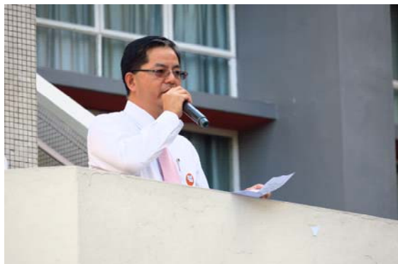
鍾校長於英語早會中演講

談及鍾校長在五年前剛上任的時候曾定下一些目標，校長回應「最重要是保存良好的學生質素、優良的品德、積極的學習態度，以及提升同學的英語能力。」為此，學校在五年內推行了不同的措施鞏固同學的英語能力及提升同學的學習動力。在提升英語水平方面，學校提供了不同的英語學習活動，例如學校逢星期五都有英語早會，希望藉此提升同學對英語的學習興趣和水準。同時學校一直以來都推動同學參與多元化的校外活動使同學有全人發展的機會。