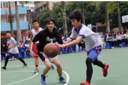
本校學生與華僑中學學生進行籃球友誼賽，最後握手言和