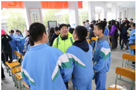
本校與江門市第八中學的學生均各自進行精彩表演，兩方學生熱烈交流，言談甚歡