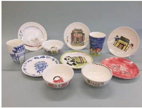
中一級同學以荃灣區特色設計了一系列陶瓷餐具，並於藝術節期間供美倫餐廳使用