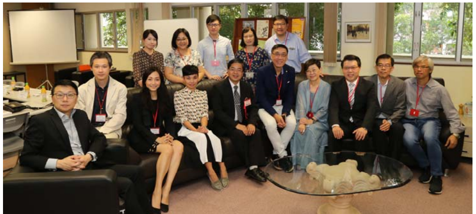
嘉賓與鍾校長及升輔組老師合照