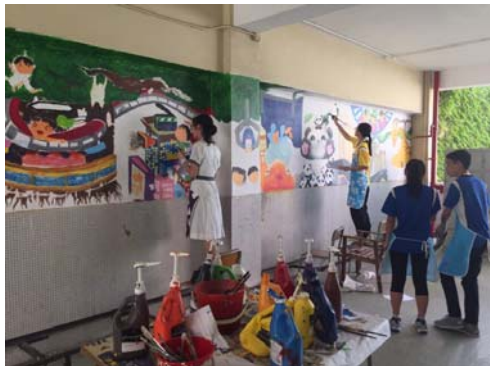
中三同學於學校三樓創作以荃灣區歷史為主題的社區壁畫