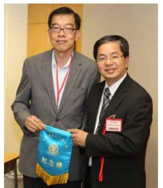
曾其鞏校長（左）與校長合照