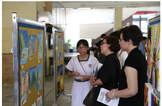
視藝學會幹事向來賓介紹同學的創作