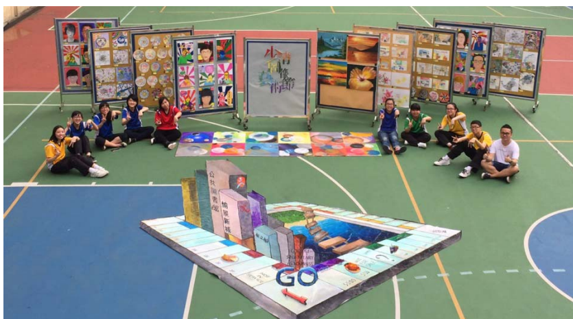
負責籌備藝術節的視藝藝術學會幹事合照