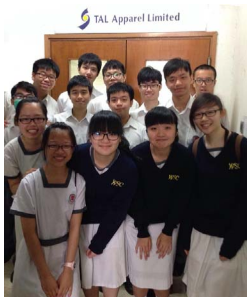
F5D Chemistry students