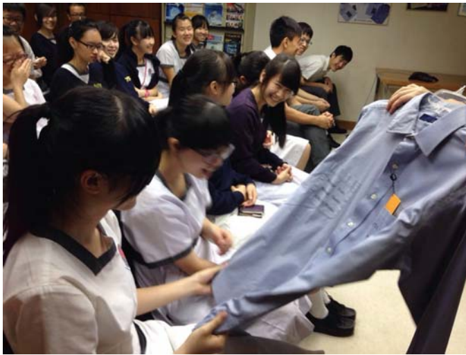
Students observing a wrinkle-free and pucker-free shirt.

In order to broaden our senior form science students' horizons in product engineering and quality management of garment industry, the Chemistry Department has paid a visit to Technical Administration Center of TAL Apparel on 2/6/2016. TAL Apparel is one of the world's largest clothing manufacturers. TAL Apparel produces shirts, blouses, knits, pants, outerwear and suits for many of the most famous garment brands.