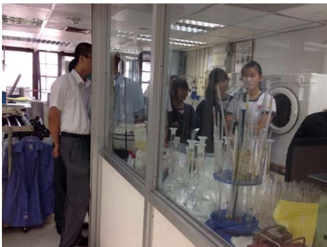
Can you see the pipettes, volumetric flasks and burettes?