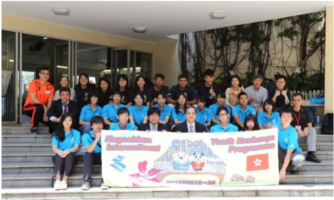
本校校長、老師與鹿兒島大學師生及日本教育部官員合照留念