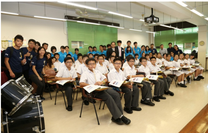
參觀本校音樂科課堂