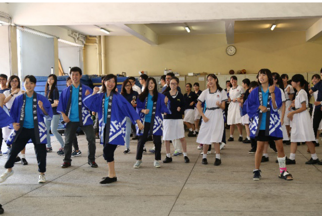
鹿兒島大學師生穿上傳統服裝，示範民俗舞步，本校學生也隨之起舞