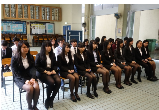
同學西裝革履，慢慢適應角色身份的轉變。