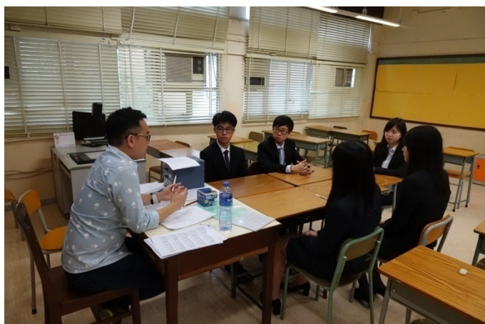
導師於面試後總結同學表現。