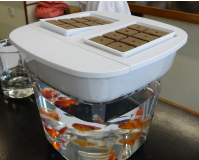
魚類、植物及微生物三者之間達到一種和諧的生態平衡關係，養魚不用換水，種菜不用施肥淋水，同時沒有蚊蟲滋擾。