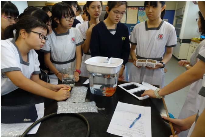
裝置中已放置小金魚，同學正全神貫注完成下一步驟。