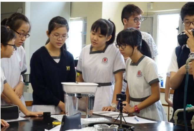
同學正觀察裝置結構以了解其運作原理。

同學分組討論有關「在港可持續生產糧食的方法」，然後作匯報，從中引領學生思考「魚菜共生」在香港發展成爲一個可持續發展產業的可能性。