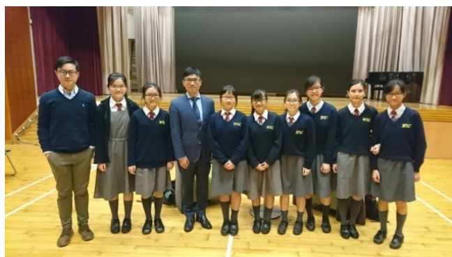
中四級生物組的同學與李登偉教授合照留念

李登榮教授是香港醫學界的中流砥柱，現任香港大學李嘉誠醫學院教授香港大學李嘉誠醫學院幹細胞及再生醫學研究中心總監，兩年多前研發出全球首個迷你人造心臟，在醫學界貢獻良多。他於3月17日在荃灣聖方濟中學舉辦生涯規劃講座，向荃灣區來自不同中學的高中同學分享了他對科學的理解、科技在未來社會的發展及其個人成功的心路歷程。在現今著重創新科技的年代，其見解及經驗對於將來每一個投身社會的青少年來說，可謂金石良言。本校升輔組老師帶領高中同學參與講座，當中本校同學更代表與會同學向李博士請教應付讀書壓力問題的方法。