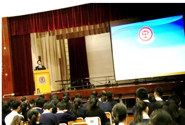
講座出席者為中四及中五級全級學生