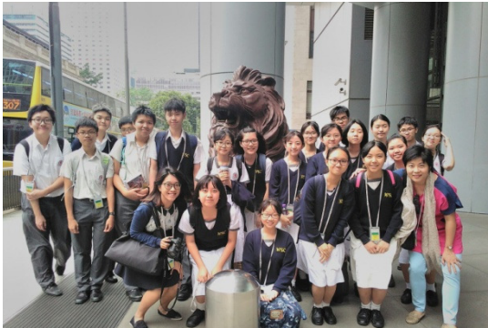
The Progressive Lion took the photo with hardworking EconElites