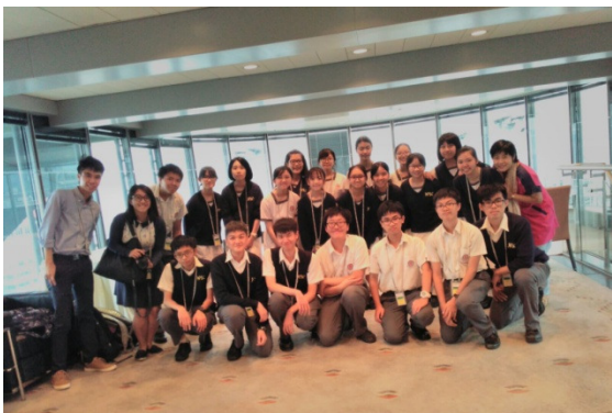
Taken at the top floor of the Bank. Guys look so smart!!