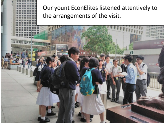
Our yount EconElites listened attentively to the arrangements of the visit.