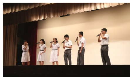
中五同學以「a cappella」方式獻唱《Let it go》