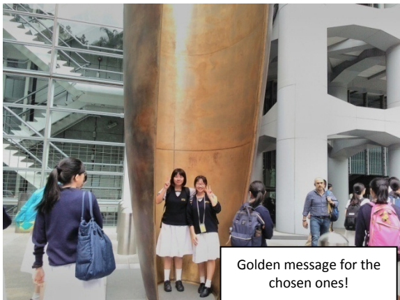
Golden message for the chosen ones!