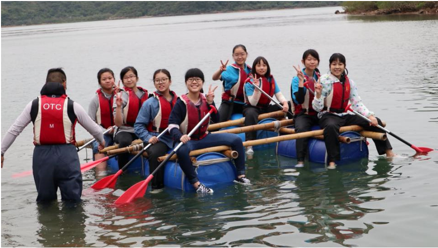
坐上親自製作的竹筏，充滿喜悅。