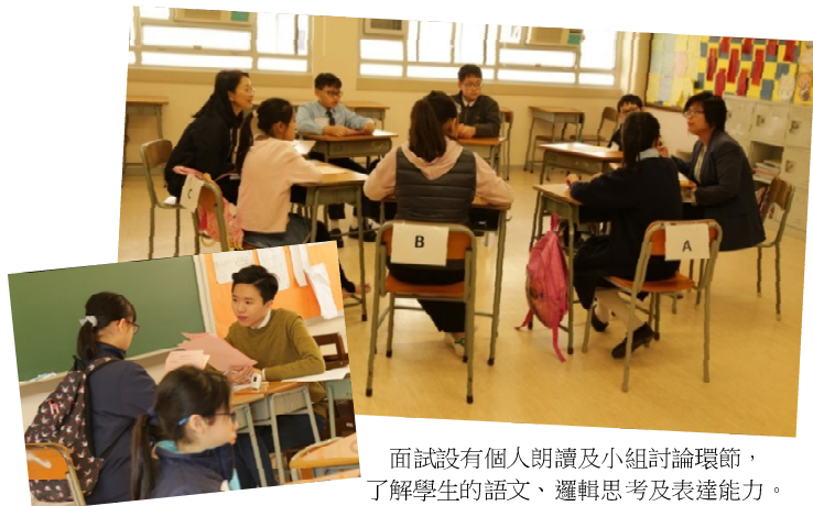
面試設有個人朗讀及小組討論環節，了解學生的語文、邏輯思考及表達能力。

本校於三月十日舉行了「中一面試日」，由本校各老師為小六學生面試，評核考生中英語文能力、時事觸覺、儀容品行。面試過程流暢，家長反應正面。