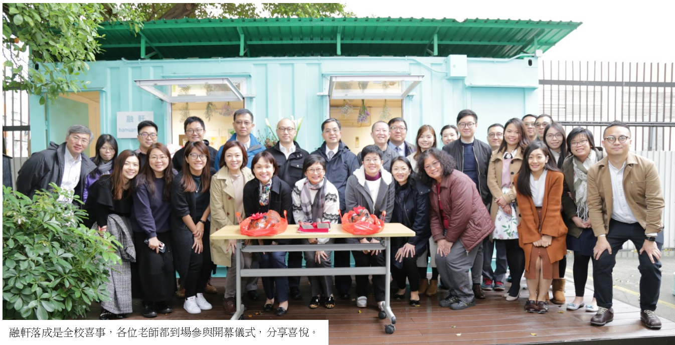
融軒落成是全校喜事，各位老師都到場參與開幕儀式，分享喜悅。

「榕軒」是一個位於校舍榕旁的一所小型貨櫃屋。它曾經是社工的辦公室、貨倉及升學及就業輔導閣。隨着校舍空間重新分配，「榕軒」在經過翻新後，易名為「融軒」。