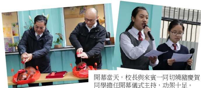
開幕當天，校長與來賓一同切燒豬慶賀。同學擔任開幕儀式主持，功架十足。