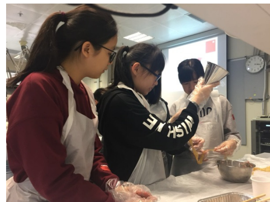
Students are making sausages by grinding and chopping meat.