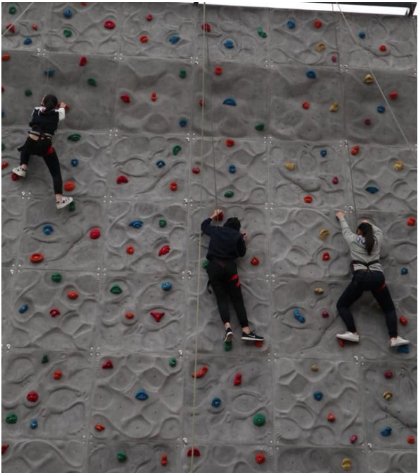
每一位隊員都能成功挑戰自己，攀越高牆。