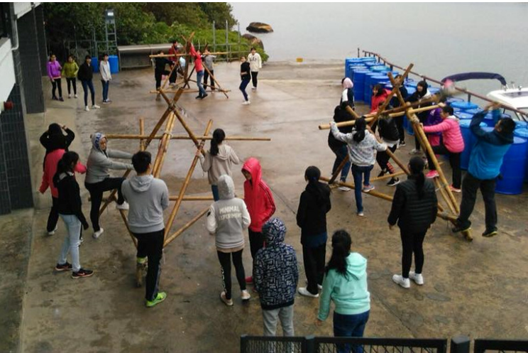
羅馬炮架水彈戰，一觸即發！