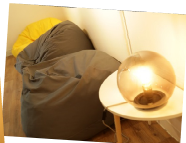
融軒內掛著同學藝術品，設有座椅，在柔和的燈光下是相聚談心的好地方。