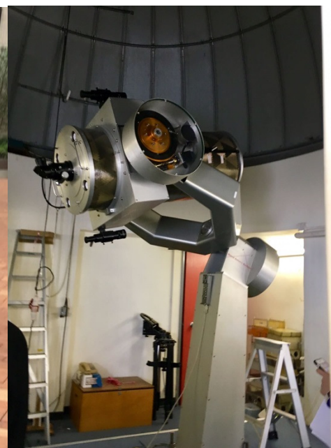
Students are observing the Sun with specially filtered telescopes