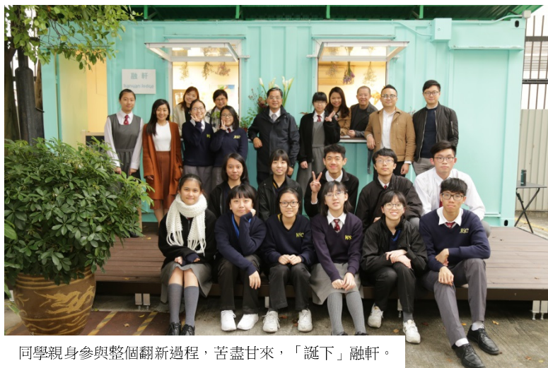
同學親身參與整個翻新過程，苦盡甘來，「誕下」融軒。

「融軒」為「賽馬會創新教師力量」的其中一個項目。去年，本校三位老師入選「賽馬會創新教師力量」成為創新教師夥伴，到訪本地及歐洲不同的創新學校考察，並於本學年獲得賽馬會慈善信託基金撥款，於校內發展一系列課程發展、輔導及藝術項目，以提升學生幸福感。