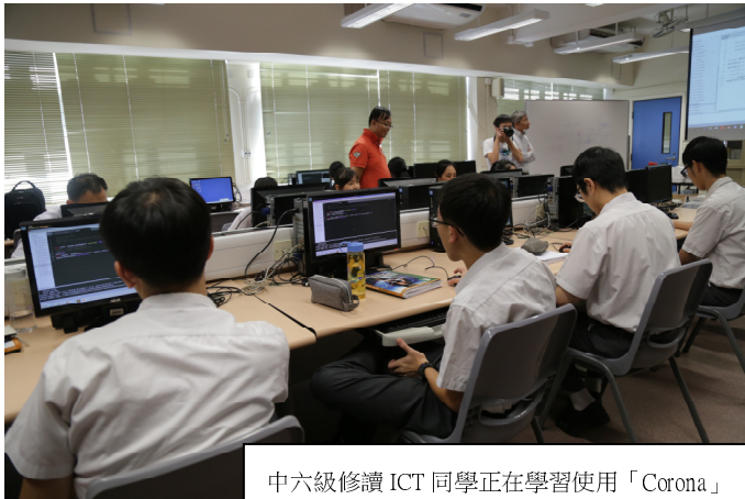
中六級修讀 ICT 同學正在學習使用「Corona」