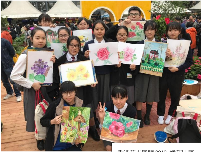
香港花卉展覽 2019 插花比賽