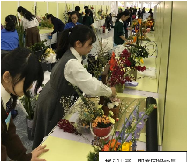
插花比賽—即席同場較量