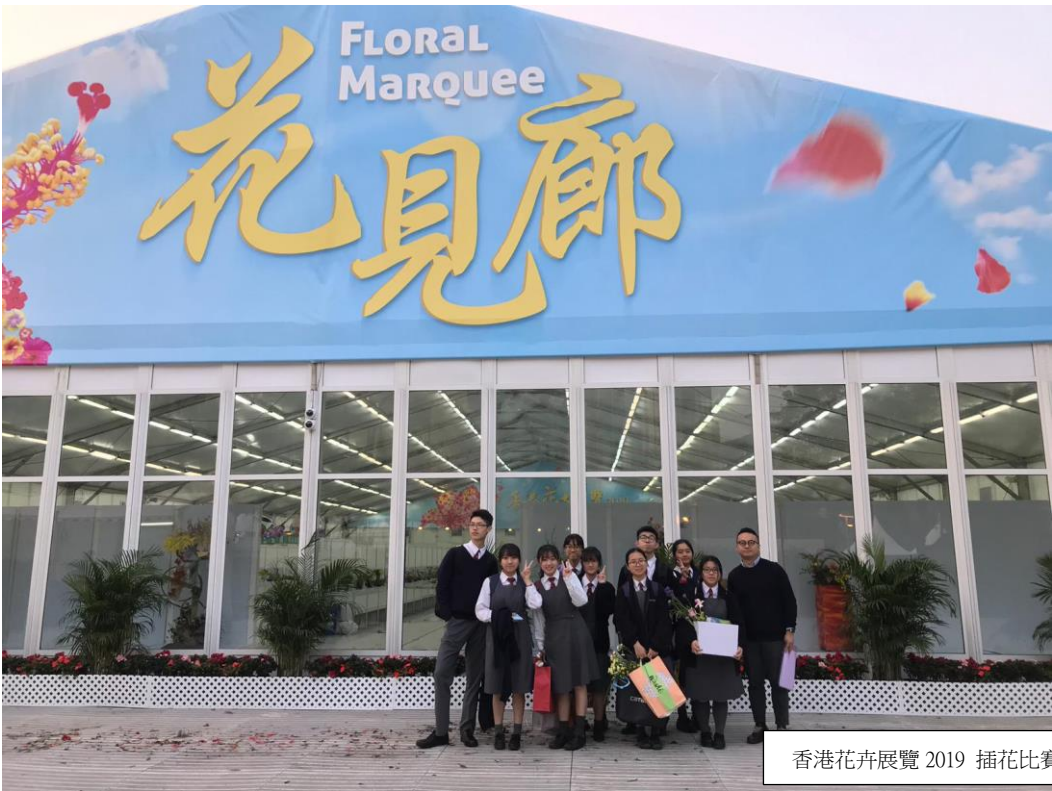
香港花卉展覽 2019 插花比賽- 本校代表團