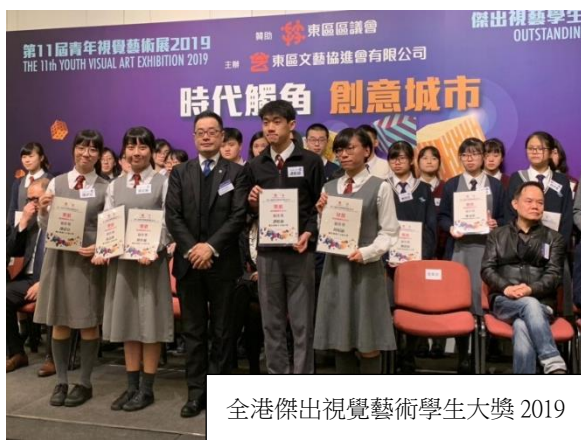
全港傑出視覺藝術學生大獎 2019