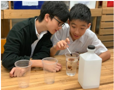
混和與汽水相近的化合物，發現原來「汽水」只是加了糖的「通渠水」。