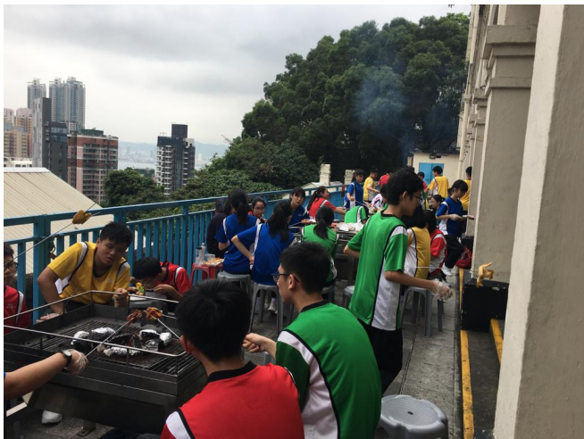
全級同學於鯉魚門公園渡假村享受一場豐富的燒烤盛宴。