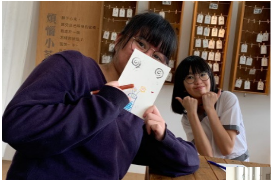
回味身邊人對自己的好，設計、書寫一張感謝卡，向他們表達自己的感激。一段寧靜自省的時光，一封以畫寄情的書箋，是一趟滿懷感恩與溫馨的心靈之旅。