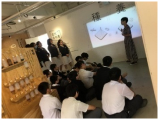
學生仰聆導賞員講解著食物的「誕生之旅」

學生參觀該書院的「食物研習室」，導師引領學生從種養、製、買賣到煮食，與食物一起經歷它的旅程，培養他們對食物的感恩之心，從而他們由心而發地珍惜食物。學生又參觀了生活書院的「感恩研習室」，透過觀察和思考日常生活的實例，扭轉習慣性的角度，培養學生發現生活的美好，以體驗式學習領略「感恩」之情。