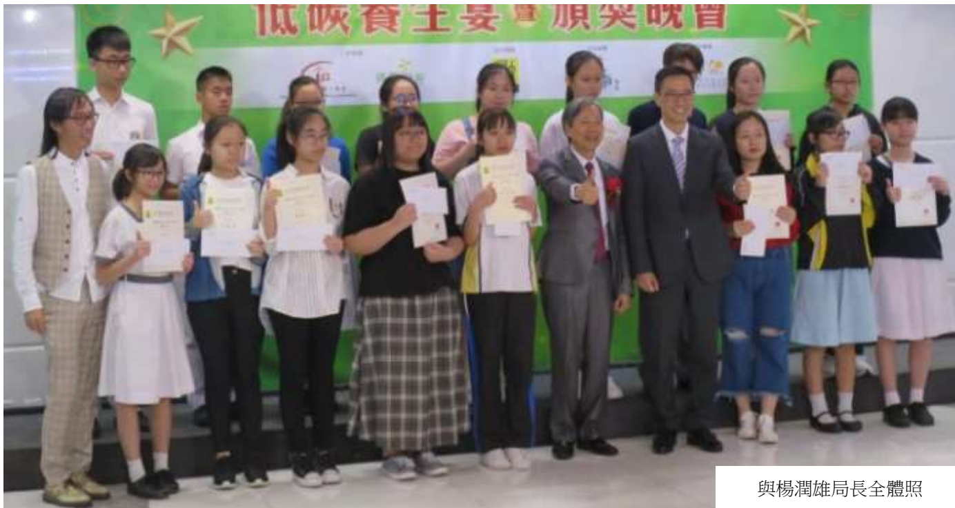
與楊潤雄局長全體照

「怪獸家長」創作比賽頒獎典禮於 10 月 22 日舉行，當晚主禮嘉賓為教育局長楊潤雄，作家班獲獎 8 位同學—劉鳳棋、黃潔心、周沁、孫綽言、劉恩儀、何思琪、鄧筠蓉及陳穎琳—獲邀出席晚宴。