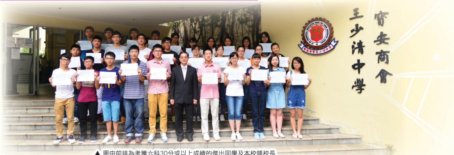
▲ 圖中前排為考獲六科30分或以上成績的傑出同學及本校鍾校長