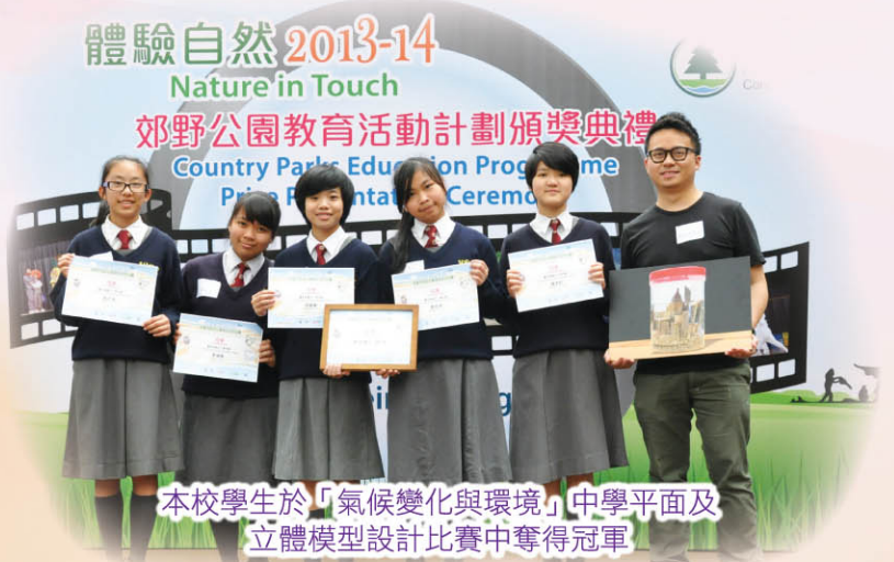
本校學生於「氣候變化與環境」中學平面及 立體模型設計比賽中奪得冠軍