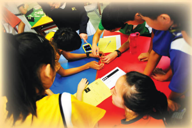
▲ 初中同學積極完成任務，誓要勝出數學比賽!

本校數學組一向銳意鍛煉學生的數理邏輯能力，經常安排同學參加各項校外數學比賽，獲得多個獎項。此外，數學組也於試後活動時間，為中一及中二同學舉辦了數學比賽。參賽者按班級分成小組，到不同checkpoint完成各項有關數學解難的任務。同學從遊戲中學習，亦發揮了團隊協作精神。