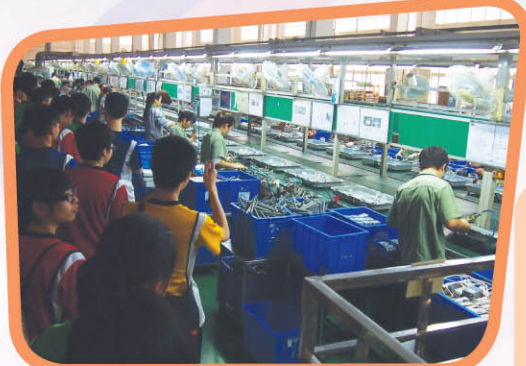
▲ 考察組裝工廠的生產線，了解中國工業的現代化及先進的企業管理。