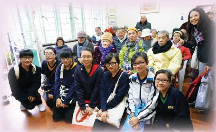
▲ 寒冬送暖活動結束前，學生與上水古洞老人院一眾老人合照留念，暖意洋溢。

培養學生成為德才兼備的社會棟樑，是本校重要的教育信念。德育及公民教育組一如既往，組織帶領學生參加由社區團體舉辦的義工服務活動，讓學生從中體會到幫助別人的快樂，把關愛的種子植根於他們心中，並培養同理心，透過服務讓他們學會了解不同人的不同需要，明白「施比受更有福」。