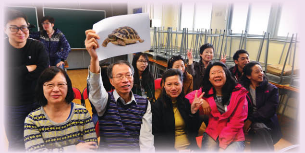
▲▼ 教師選擇一幅與自己性情相近的動物圖片

在本學年三天的教師發展日，本校同事參加了一系列名為「自主學習」、「課堂管理」、「提升與家長及學生溝通技巧」和「協助SEN學生」的工作坊，讓本校同事對以上課題有更深切了解。此外，校長亦於學期末宴請所有教職員於荃灣如心酒店享用自助午餐，以慰勞一眾同事一年來堅守崗位、努力付出。