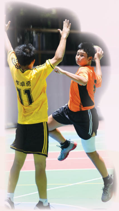
本校連續第十六年奪得學界荃灣及離島區男子手球總冠軍

中英文朗誦：四冠八亞九季 華夏杯全國數學奧林匹克邀請賽：華南賽區晉級賽特等獎及二等獎、全國總決賽三等獎 香港賽區初賽一等獎及兩項二等獎 2014 培正數學邀請賽：銅獎及優異獎 香港理工大學數學及科學比賽 (SSMSC 2014)：一項化學科金獎、一項物理科金獎、一項化學科高級優異獎、物理科高級優異獎及數學科高級優異獎各六項 香港中學生生物學奧林匹克比賽二等榮譽獎及優異獎