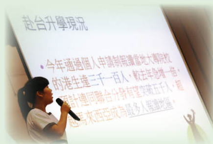
▶ 同學於交流團分享會中講述在台灣參訪的所見所聞及赴台升學的可行性。