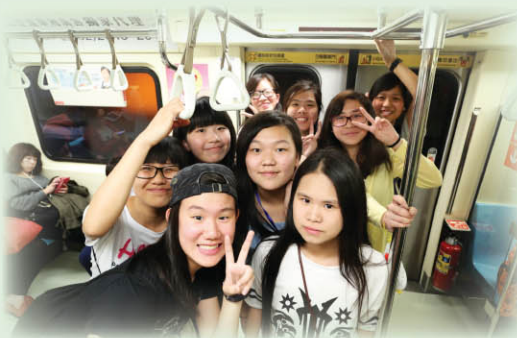
▲ 同學乘坐台北捷運，了解當地民生概況。