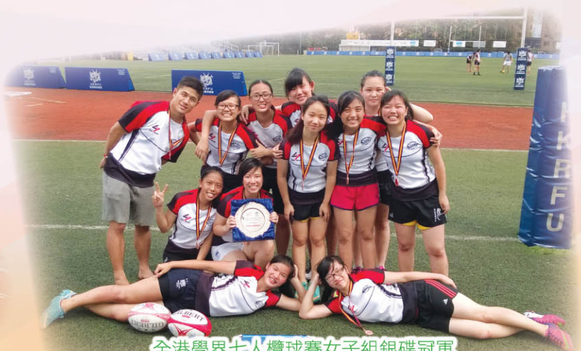
全港學界七人欖球賽女子組銀碟冠軍