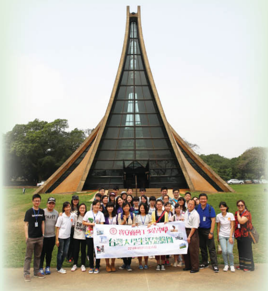
▲ 本校師生於東海大學著名地標路思義教堂前拍照留念