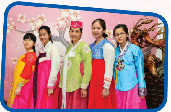
▲ 同學身穿傳統韓服，粉紅櫻花的背景更能襯托出韓服的五彩繽紛。