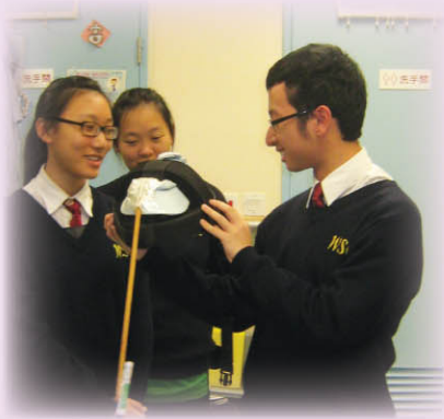
◀ 本校義工隊探訪扶康會順利成人訓練中心，同學正預備生日派對中的遊戲道具，與智障人士一同慶祝生日。