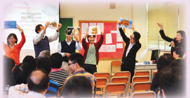
▲ 教師高舉代表自己性格的動物圖片，講者以此分析不同人格特徵所可能產生的衝突，以及說明排解糾紛之道。