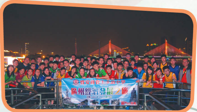
▲ 乘船夜遊珠江，飽覽沿岸廣州璀璨夜景。