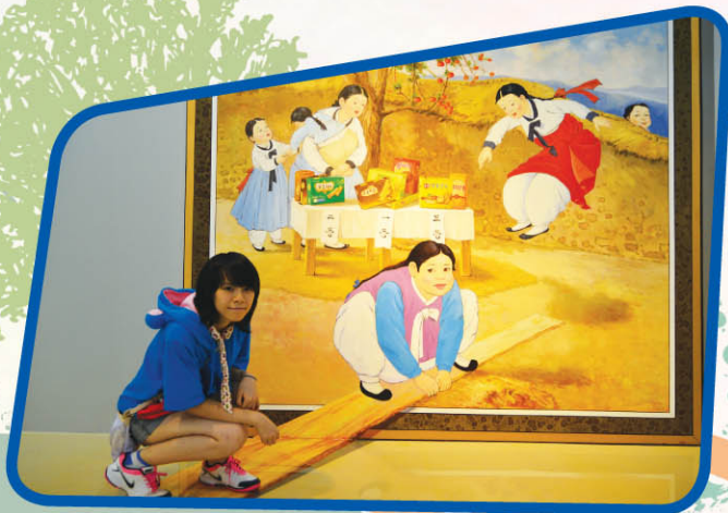
▲ 學生參觀Trickeye特麗愛3D美術館，置身疑幻疑真的立體畫作世界。