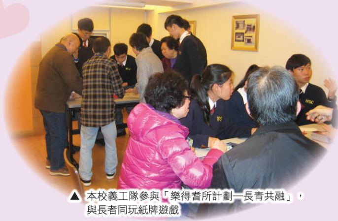
▲ 本校義工隊參與「樂得耆所計劃—長青共融」，與長者同玩紙牌遊戲