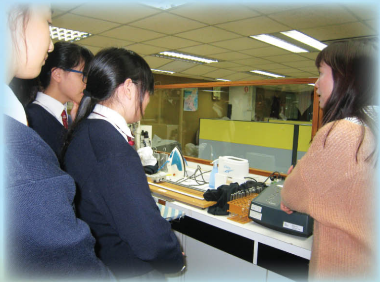
▲ 參觀香港企業聯業製衣有限公司技術行政中心的實驗室，了解其測試布料技術，及研發特別布料的過程。