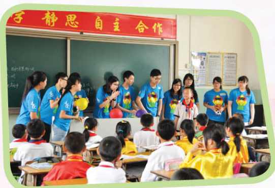
▲ 本校同學於棠下沙富小學義教英文，「師生」樂也融融。