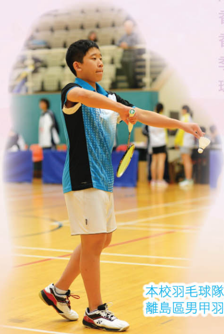
本校羽毛球隊勇奪荃灣及 離島區男甲羽毛球總冠軍

八名學生獲香港資優教育學苑錄取 本校女童軍連續第二年獲選為女童軍 隊優秀隊伍 第六十六屆校際音樂節外文歌曲混聲：初級組冠軍 第三屆 香港亞洲音樂比賽暨幼兒歌唱大賽：「鋼琴組」冠軍及「長笛組」亞軍 香港演藝音樂節：鋼琴八級亞軍 2014 立體珊瑚紙藝月曆設計比賽：中學組 季軍 2013 國際水合作年美術設計創作比賽：香港賽三等獎 「氣候變化與 環境」中學平面及立體模型設計比賽：中學組冠軍 全港學界「光的藝術」