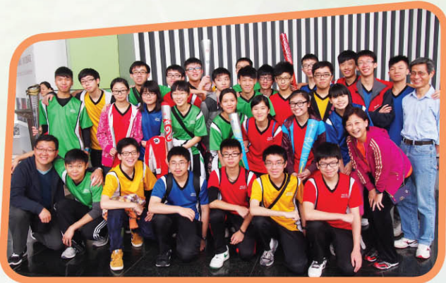
▲ 參觀生產2008年北京奧運火炬的華帝燃具公司