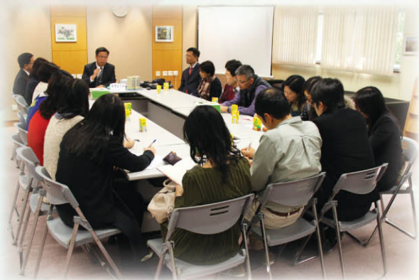
▲ 黎耀庭先生主持教師研討會，與會者有本校校長、三校中文科主任及部分中文科任老師。

為了讓高中同學更深刻了解中文科文憑試各卷的考試要求，提升應試能力，本學年中文組特別邀請了教育局語文教學支援組高級學校發展主任黎耀庭先生於本校舉行應試策略講座，為學生講解各卷考核要求及應試技巧。黎先生為資深考評專家，於教育局及考評局常居於一線領導考評工作。參與者除本校學生外，還有善德中學及安柱中學的校長及師生。學生講座前，黎先生更特別撥冗為三校中文科教師舉行了一個小型分享會，向同工分析應試策略及施教竅門。此外，本學年科組亦先後兩次聯絡友校師生進行文憑試口試模擬訓練及相關講座，合作學校分別為安柱中學及藍田聖保祿中學。