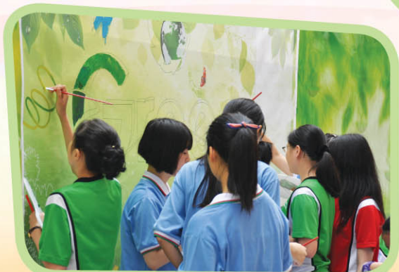
▲ 到訪江門市第八中學，與該校學生作藝術交流，同繪壁畫，見證友誼。