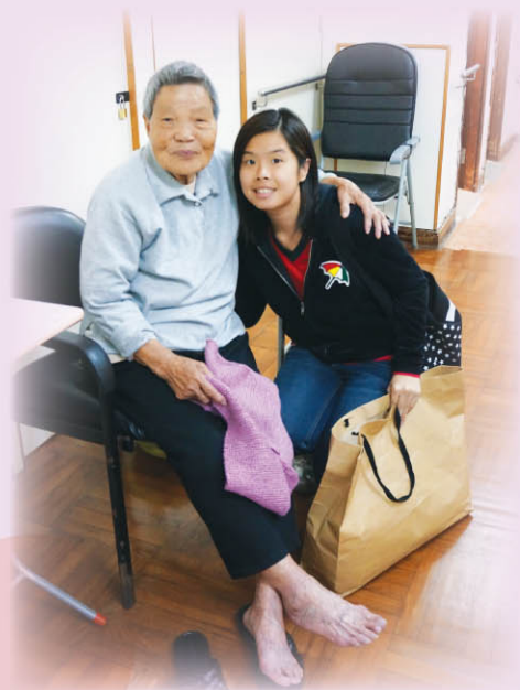
▲ 寒冬送暖活動，學生探訪上水古洞老人院，並送上親手編織的頸巾