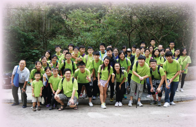
▲ 本校義工隊成員參加的華懋行慈善步行籌款活動，既有益身心，又可幫助別人，一舉兩得。