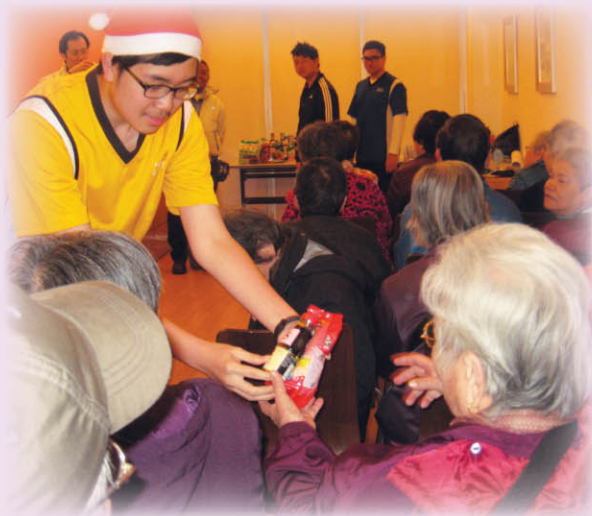
▲ 本校義工隊在「樂得耆所計劃—長幼共融」中與長者歡聚聖誕，並送上別具心意的禮物。