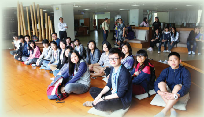
▲ 佛光大學位處半山，風景怡人，在此讀書實為賞心樂事。