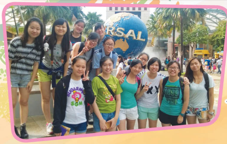
◀ 一眾欖球女將卸下「戰袍」，一身輕裝暢遊環球影城。