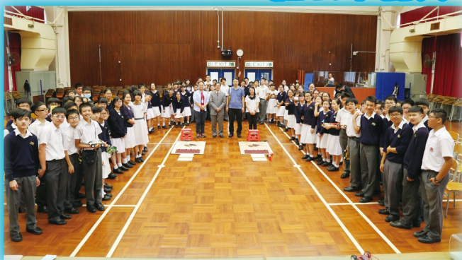
所有中二級同學在禮堂參賽，陣容鼎盛。