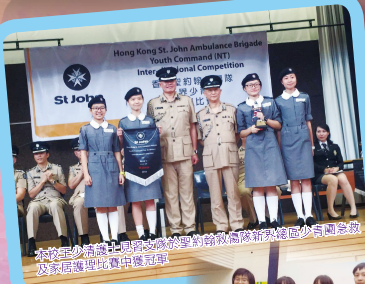
本校至少清護士見習支隊於聖約翰救傷隊新界總區少青團急救及家居護理比賽中獲冠軍