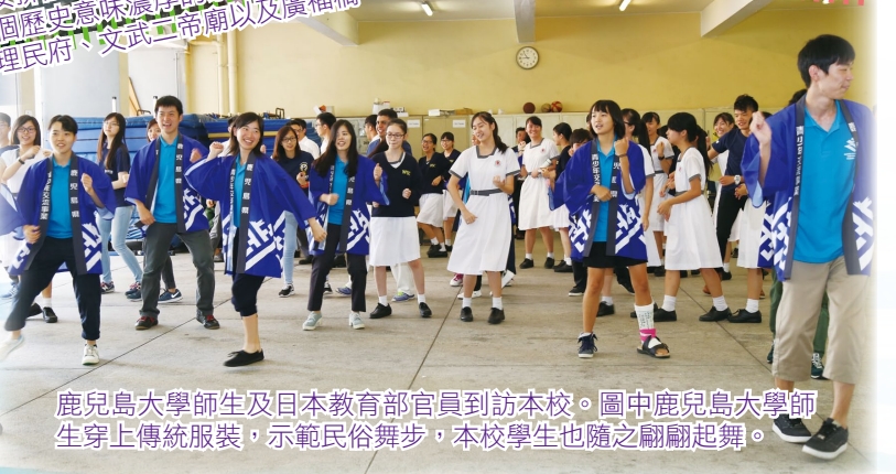
鹿兒島大學師生及日本教育部官員到訪本校。圖中鹿兒島大學師生穿上傳統服裝，示範民俗舞步，本校學生也隨之翩翩起舞。