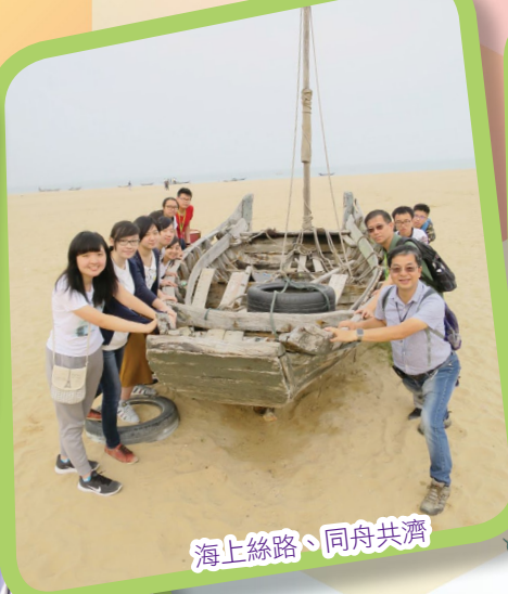
海上絲路、同舟共濟