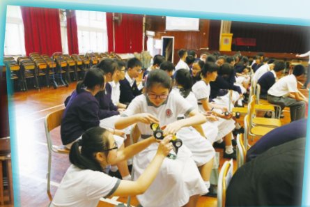
同學在比賽前已學習裝嵌電動車，在賽前繼續調整車輛至最佳水平。