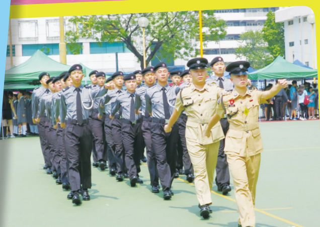
本校聖約翰救護見習支隊參與制服檢閱及步操比賽，在制服檢閱項目獲得亞軍，更協助新界西分區獲取全場總冠軍。