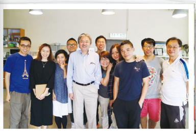
巧遇特首選舉候選人曾俊華先生