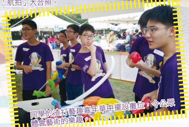
同學於渣打藝趣嘉年華中擺設攤位，令公眾體會藝術的樂趣。