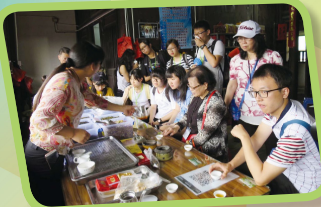
同學在華安土樓三宜樓內品茗

為深化國民教育，了解國家最新發展，本校校長於5月親自率領一群成績優異生參與「香港百人學生『一帶一路』研習交流團（四）海上絲綢之路傳文化」，遠赴海上絲路的起點一泉州及廈門考察，加深了解對一帶一路及當地歷史及文化的認識。是次參與單位還有本區何傳耀紀念中學及梁省德中學。三所學校均由校長親自「領軍」。