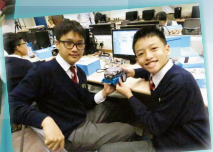
捧著精心傑作，同學笑逐顏開。