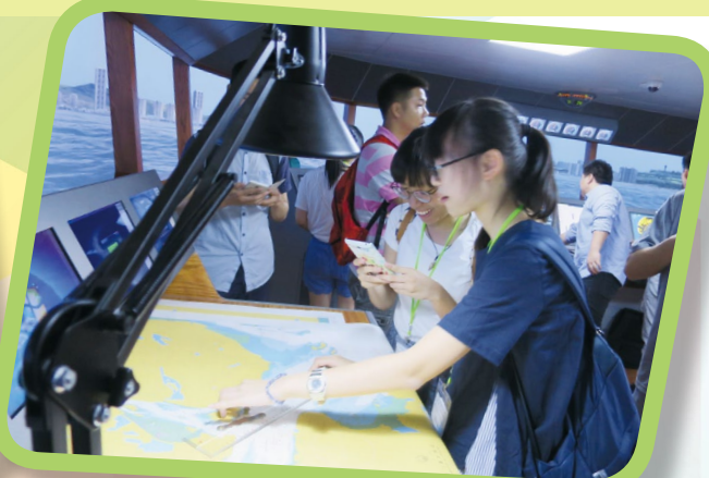
本校同學參觀集美大學的「大型船舶操縱模擬器」