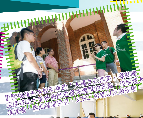
恆隆地產為本校安排的「大埔文化建築」導賞團，深度遊走大埔多個歷史意味濃厚的景點，包括舊大埔警署、舊北區理民府、文武二帝廟以及廣福橋。