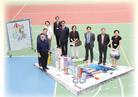
「少清圖像藝術節」向來訪的多所中學校 長展示以超現實視覺效果呈現社區情景的 「立體錯視畫」。