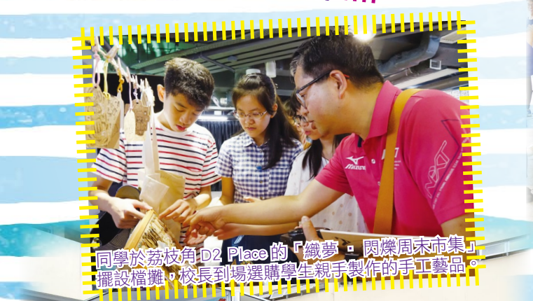
同學於荔枝角 D2 Place 的「織夢・閃爍周末市集」擺設檔攤，校長到場選購學生親手製作的手工藝品。