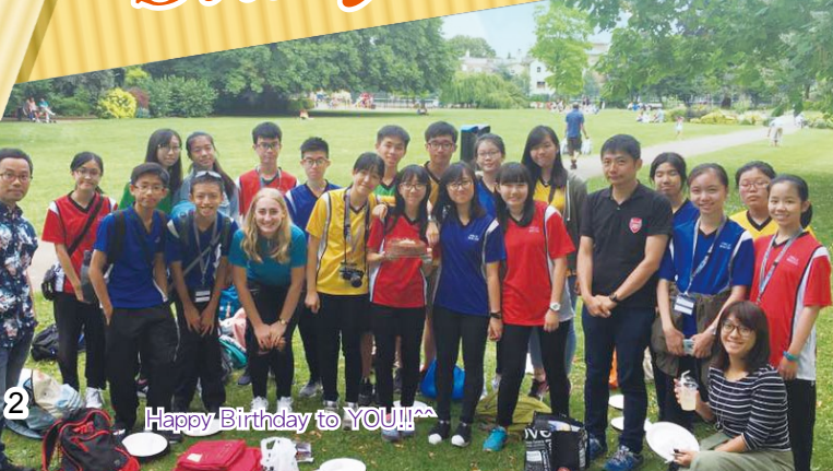
Happy Birthday to YOU!!!