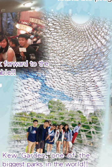
Kew Garden, one of the biggest parks in the world!!