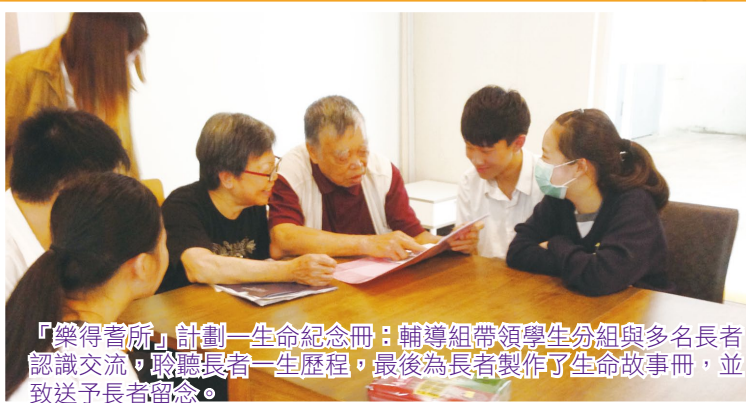
『樂得耆所』計劃一生命紀念冊：輔導組帶領學生分組與多名長者認識交流，聆聽長者一生歷程，最後為長者製作了生命故事冊，並致送予長者留念。