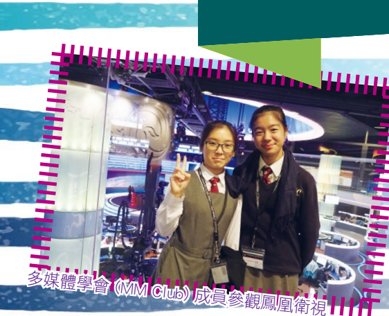
多媒體學會 (MM Club) 成員參觀鳳凰衛視