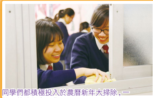
同學們都積極投入於農曆新年大掃除，一絲不苟地努力工作。