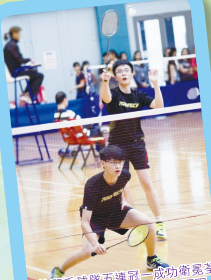
本校羽毛球隊五連冠一成功衛冕荃灣及離島區中學校際羽毛球比賽冠軍