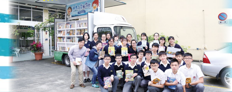
台灣佛光道場派出「雲水書車」蒞臨本校舉行書展，並安排了義工為本校同學舉辦讀報技巧工作坊。本校圖書館安排了約十班同學參與活動，反應熱烈。