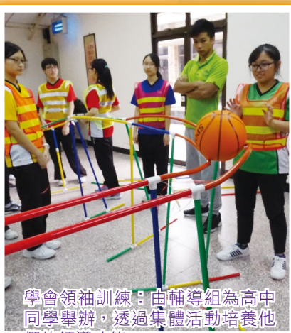
學會領袖訓練：由輔導組為高中同學舉辦，透過集體活動培養他們的領導才能。