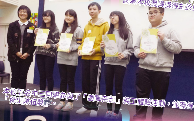
本校五名中三同學參與了「義軍突起」義工體驗活動，並獲得「傑出隊伍獎」。