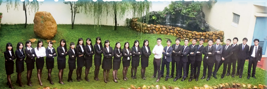
中六同學穿上西服參與模擬面試，展現自信一面！