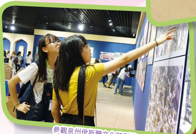
參觀泉州伊斯蘭文化陳列館