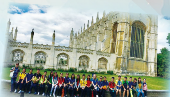
Cambridge - What a nice day with wonderful weather!

Our S4 students enjoy the radio show a lot and many students dedicate songs to their beloved teachers and friends during lunch time!!