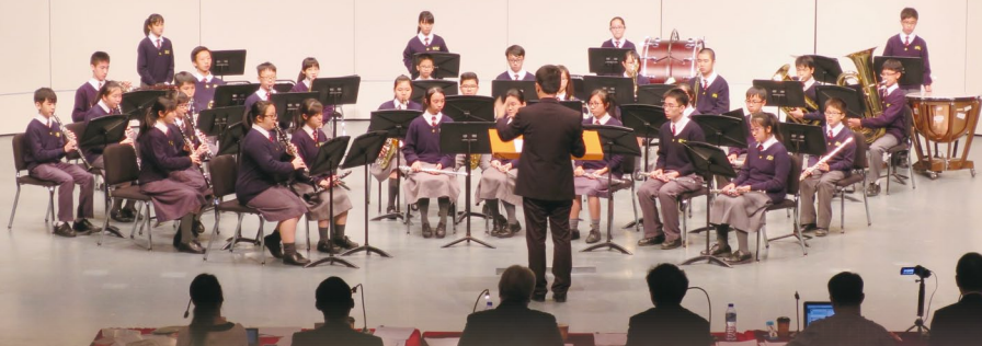
本校管樂團於 2016 香港青年音樂匯演—管樂團比賽奪銀獎