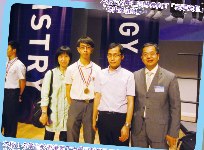
本校 8 名學生於香港理工大學及科學比賽中表現出類拔萃，力壓全港其他 7000 名參賽者，獲一項金獎及 10 項高級優異獎。