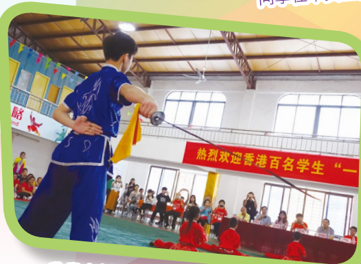
欣賞泉州南少林國際學校的武術表演