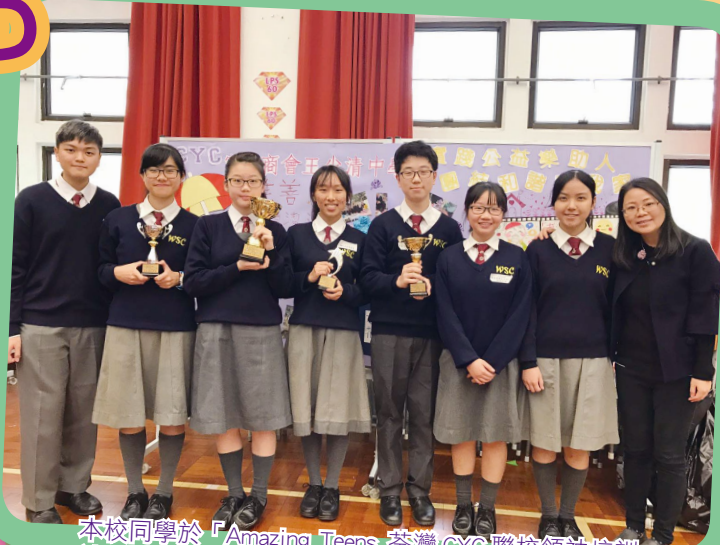
本校同學於「Amazing Teens 荃灣 CYC 聯校領袖培訓計劃 2016」中獲「專業報告大獎」、「評判大獎」和「我最喜愛大獎」