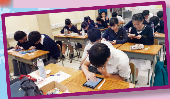
中三及中六選科心理測驗：為助同學選科，升輔組提供具科學實證的心理測驗予中三及中六級同學，著他們利用 IPAD 了解個人性向、能力及興趣，選擇更合適自我的課程。