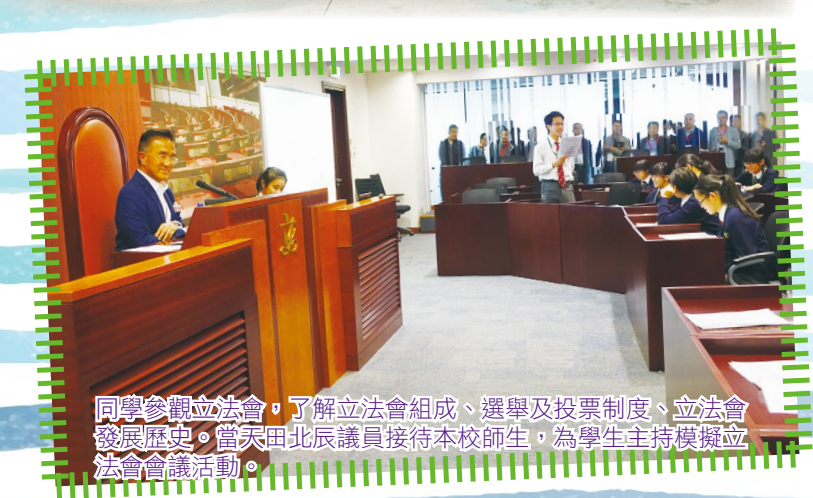
同學參觀立法會，了解立法會組成、選舉及投票制度、立法會發展歷史。當天田北辰議員接待本校師生，為學生主持模擬立法會會議活動。