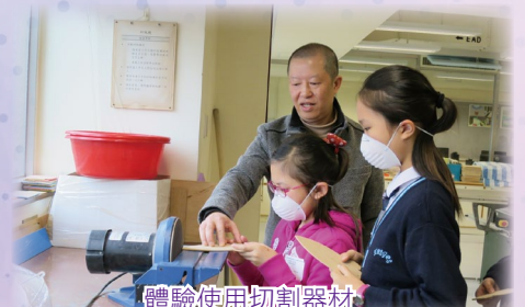
體驗使用切割器材