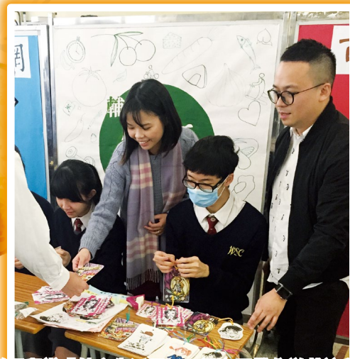
輔導組舉辦「健康生活周」，設立了攤位遊戲讓學生了解精神健康的重要性。