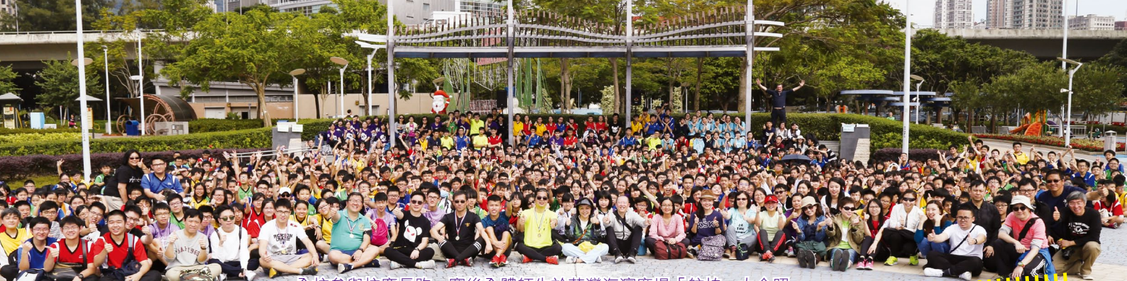
全校參與校慶長跑，賽後全體師生於荃灣海濱廣場「航拍」大合照。