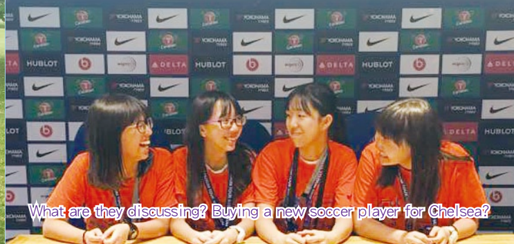
What are they discussing? Buying a new soccer player for Chelsea?