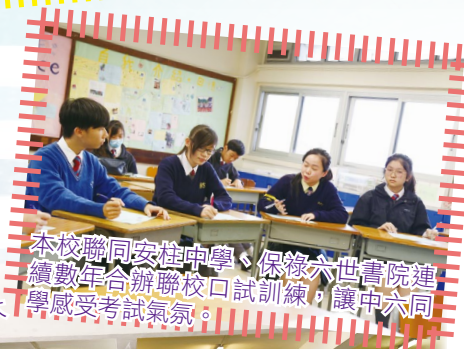
本校聯同安桂中學、保綠六世書院連續數年合辦聯校口試訓練，讓中六同學感受考試氣氛。