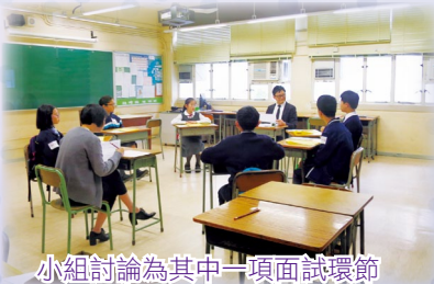
小組討論為其中一項面試環節