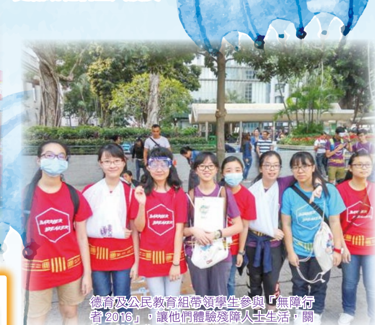
德育及公民教育組帶領學生參與「無障行者 2016」，讓他們體驗殘障人士生活，關懷弱勢社群。