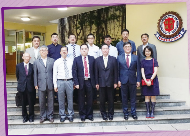
Incorporated Management Committee Members (2016-17)