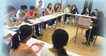
Very attentive in class!!

In general, students have gained a lot from the trip and they all found the program inspiring and challenging.