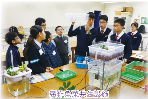
製作魚菜共生設施

當天上午為體驗課，課堂包括科學、科技應用、電腦、工藝及藝術設計等，課堂設計以「學生為本」，參與課堂的小學生都感到興味盎然。同日下午為小六學生面試，評核考生中英語文能力、時事觸覺、儀容品行。面試過程流暢，家長反應正面。