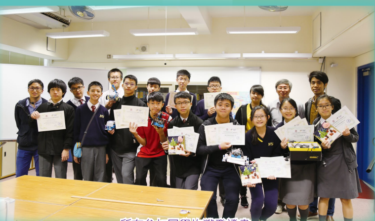
所有參加同學均獲發證書