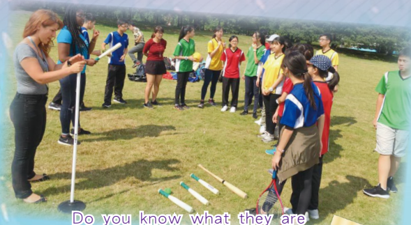
Do you know what they are learning in sports lessons?

In the morning, they all went to a language school in Greenwich. Not only did they learn English from the tutor, they also got ample opportunities to interact with other foreign students who are mainly Italians and Spaniards. In the afternoon, students visited different scenic spots including Cambridge University, the British Museum, the Transport Museum, V&A Museum, Shakespeare's Globe. They also watched the English Musical 'Les Miserable' at Piccadilly Circus in London.