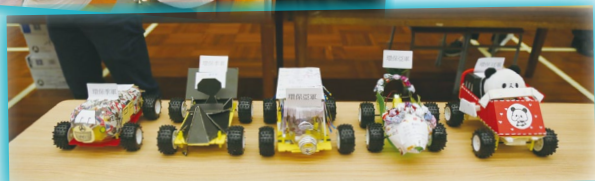
除計時賽外，另設環保設計獎，鼓勵利用廢物製作、包裝電動車車身。