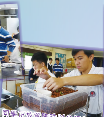
同學正放置陶珠以分解魚的排泄物轉化為養分，提供給植物幼苗