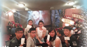
Wow! They all look forward to the musical- Les Miserable!!