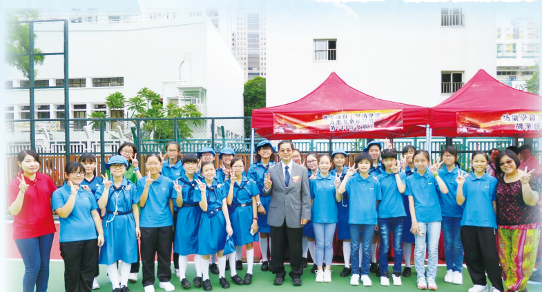
本校女童軍出席「荳灣各界慶祝中華人民共和國成立 67 周年・荳灣區中學暨制服團體升旗禮暨大會操」，在莊嚴儀式下，體現對國家及國民身份的認同。

本校一向致力為學生提供服務社群的學習機會，讓他們從中體會助人之樂，提升公民意識，並在過程中訓練其溝通協作等共通能力。本年德育及公民教育組、女童軍、輔導組等均舉辦了多項活動，讓同學回饋社區，服務社群之餘，更協助他們全人發展。