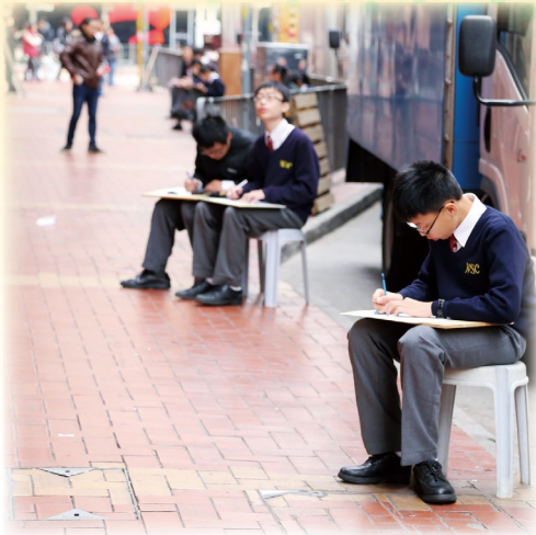
同學學習五感觀察技巧後，實踐於街頭寫生， 並以其寫生街道一大壩街一為背景創作文章 《被遺忘的风景》。