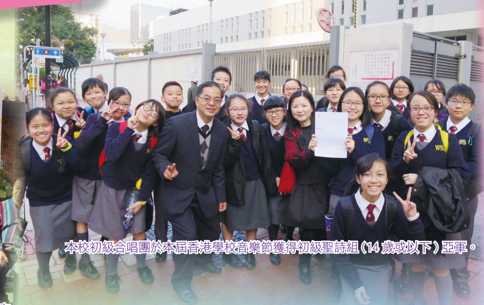
本校初級合唱團於本屆香港學校音樂節獲得初級聖詩組(14歲或以下)亞軍。