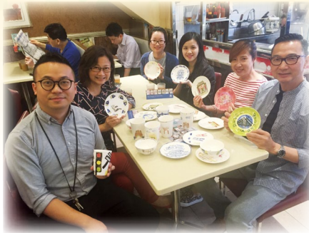
中一級同學設計代表荃灣的特色圖案， 繪製於陶瓷杯碟上，提供給區內老字號 茶餐廳使用，讓街坊可以一邊享用早餐， 一邊了解荃灣區的歷史和文化特色。