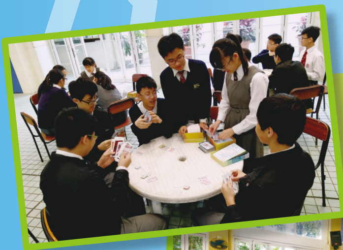
築夢工程紙牌遊戲 (DreamCrafters)：中二同學從中認識「荷倫職業代碼」，促進他們認識各類工作的特質。

模擬人生遊戲 (Soci-Game)：中四級同學於「其他學習經歷日」(OLE DAYS)，體驗模擬人生過程，經歷放榜、選科、擇業等不同階段，在活動末段作反思分享。