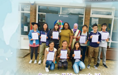
Congrats !! You made it!