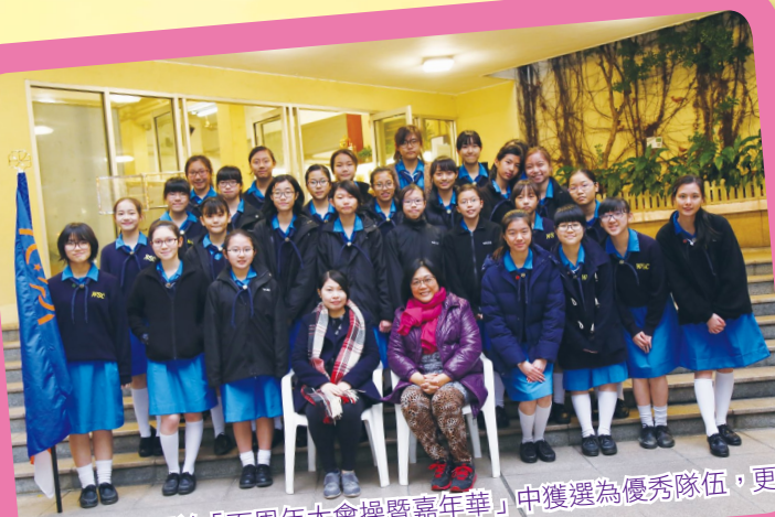
本校女童軍於「百周年大會操暨嘉年華」中獲選為優秀隊伍，更獲頒隊伍服務最高時數獎