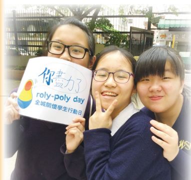
本校學生在輔導組老師帶領下響應「全城關懷學生行動日」，以攤位展示「三色不倒翁」，提示學生要學習其永不言棄、一跌彈起的積極人生態度，並邀請師生撰寫打氣字句，拼發積極正能量。