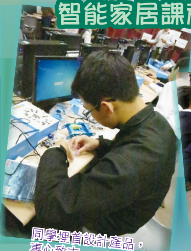
同學埋首設計產品，專心致志。