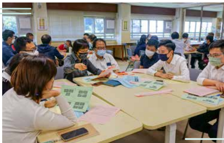
工作坊期間，教師分組討論和角色扮演，以互動形式實踐講座內容。

本校是一所「升學型」中學，歷年來文憑試成績優異，絕大部份學生均繼續升學，接受大專教育，成為社會上各個專業領域的精英。此有賴師生共同努力，追求卓越，精益求精。本學年邀請了香港中文大學教育研究所的專業團隊作顧問，為本校提供持續優化教學的支援。該團隊與本校教師舉行多場會議，了解校情，給予針對性優化建議；又為本校中層教師舉辦多場工作坊，分享各種擬題策略，以進行數據分析，掌握學生有待改善的地方，再施以針對性措施跟進。此外中大團隊亦提供不少優化方案，讓本校全面開展跨課程閱讀(Reading Across Curriculum)及英語跨科運用(Language Across Curriculum)，提升學生學習效能。