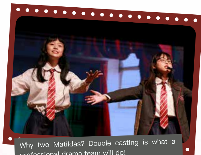
Why two Matildas? Double casting is what a professional drama team will do!