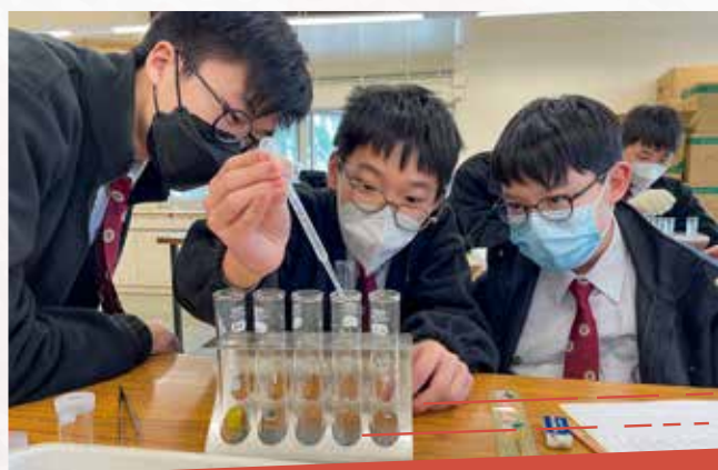
零距離科學工作坊