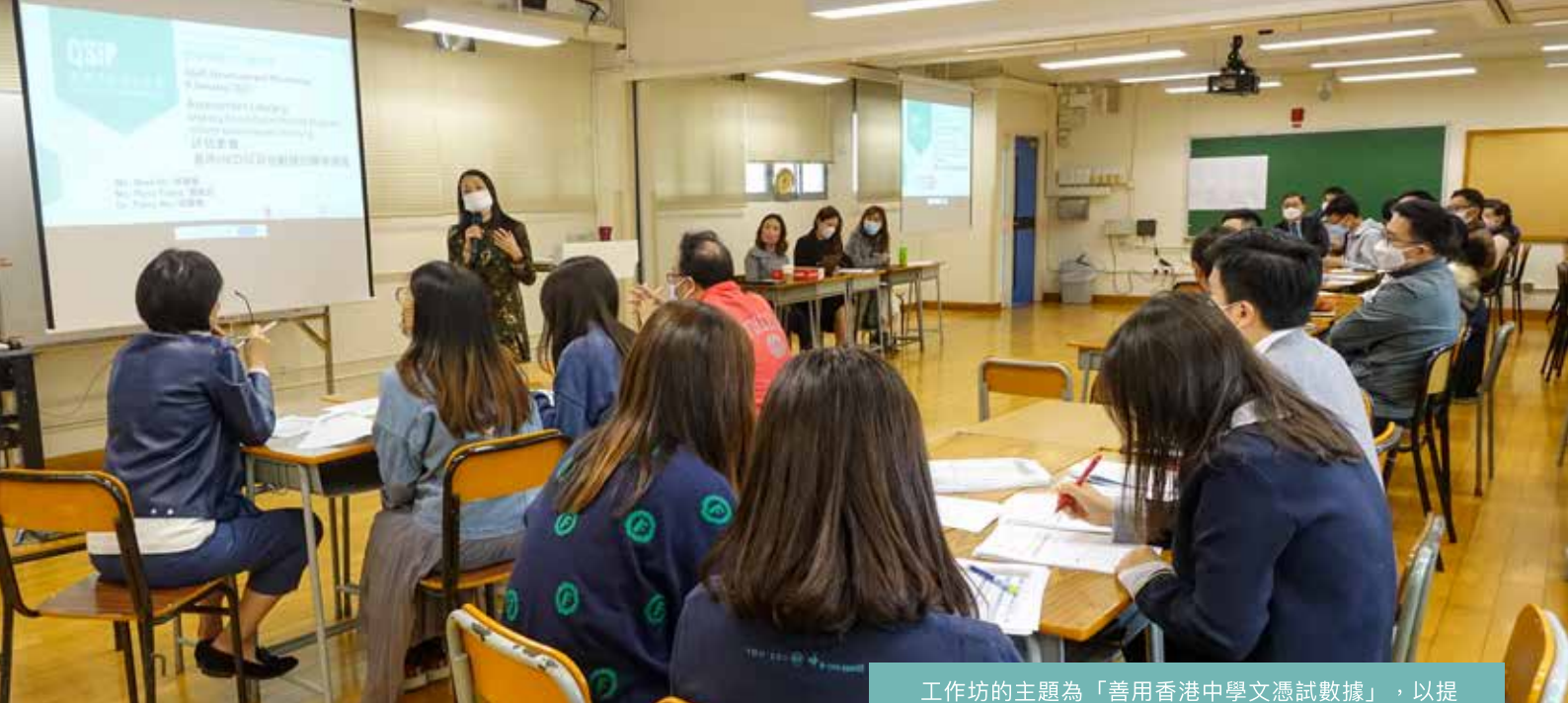
工作坊的主題為「善用香港中學文憑試數據」，以提升本校教師團隊的評估素養。