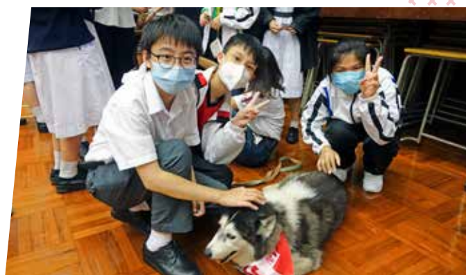
◆ 非牟利獸醫服務協會講座