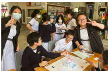
中五級學生為中一級學生舉辦攤位遊戲，讓師弟妹感到開心、溫暖和幸福。