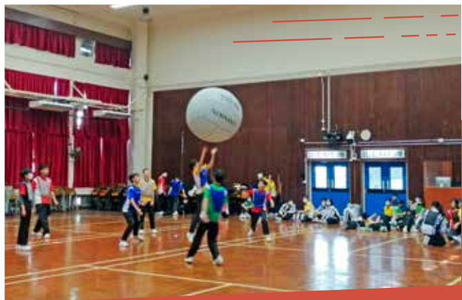
新興集體運動—健球