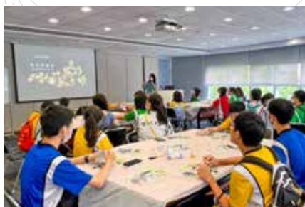
參觀「鑠古鑄今〈二〉： 中國古代黃金工藝與傳承」