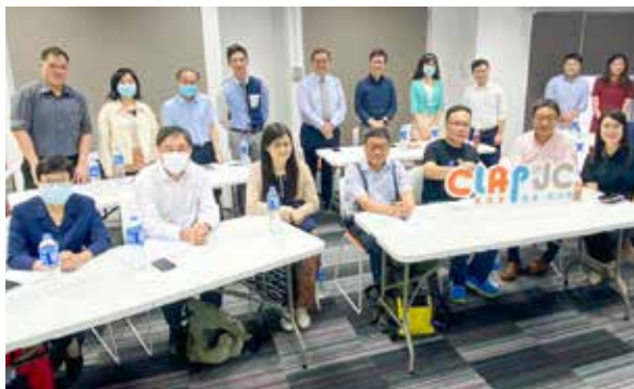
本組老師與香港新興科技教育協會及友校交流，了解人工智能對教育界的啟示及應對方法。