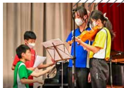
中一學生為答謝中五學長，為他們預備了才藝表演，表達感恩之情。