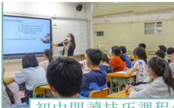
初中閱讀技巧課程

蒲書館以教育公眾理解「綠色閱讀」為營運理念。除了推廣閱讀外，亦讓學生了解書籍循環流動的環保理念。