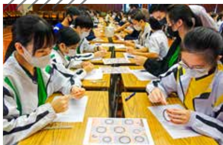
學生書寫心意卡予老師及家長，培育感恩之心。