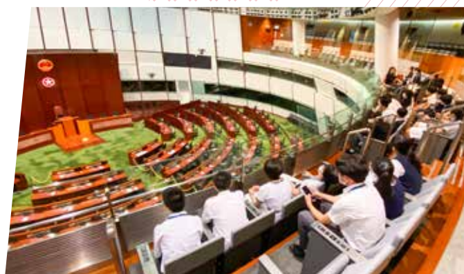
◆ 中四級公民與社會發展科活動 參觀立法會