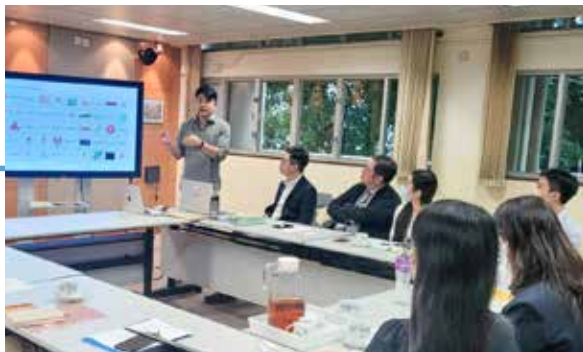
計劃企業顧問(Enterprise Advisor) 親臨本校與副校長及本組同事舉行會議，初擬來年合作的方向。