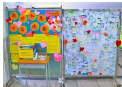
感恩專題壁報板展示學生書寫的心意卡。