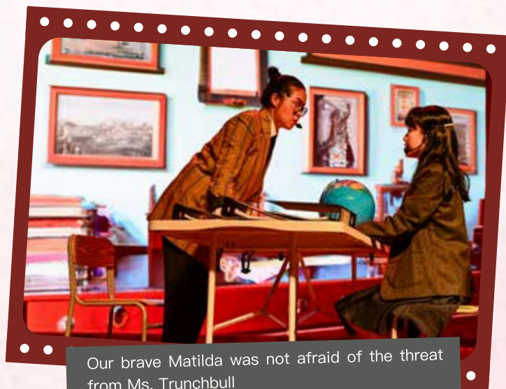
Our brave Matilda was not afraid of the threat from Ms. Trunchbull