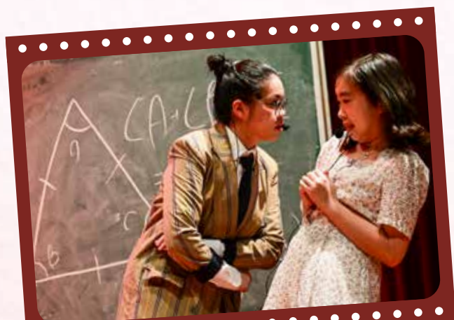
Miss Honey was scared by her boss- Scary Ms. Trunchbull.