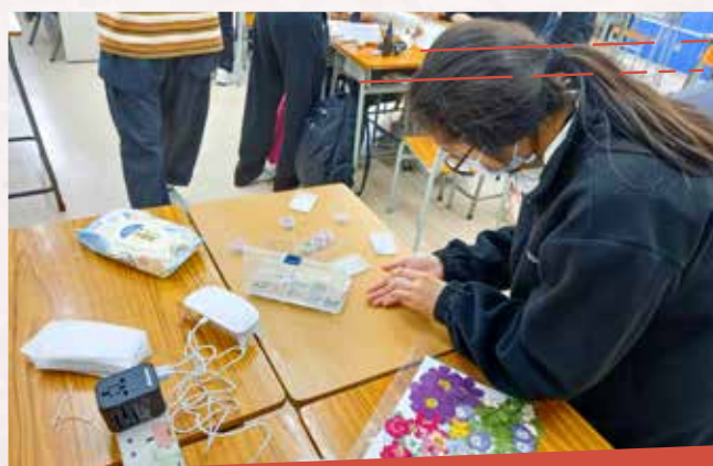
「心靈療癒」手作體驗活動