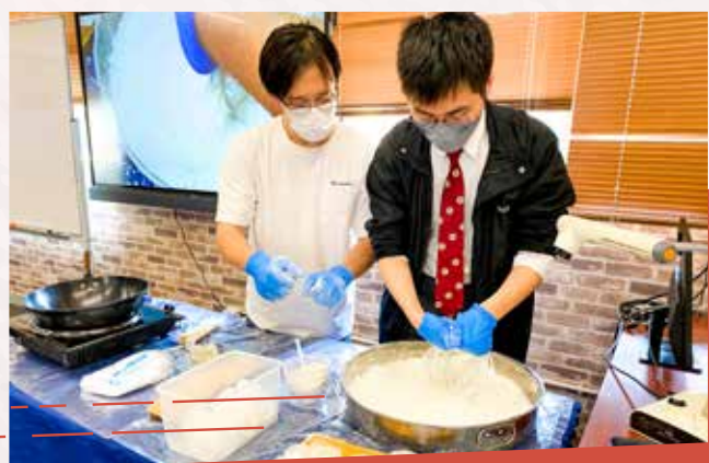
傳統小食製作工作坊