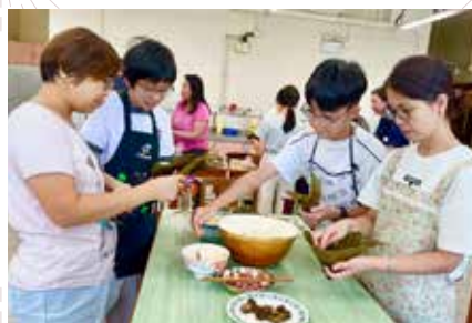
家長教師會 端午節包糉工作坊