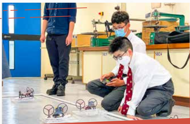
Micro:bit模型氣墊船工作坊