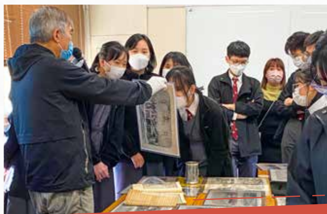
文物入校園工作坊