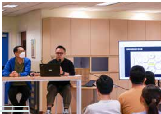
本校教師於學年末的教師發展日作專業交流，分享實踐經驗及成果。