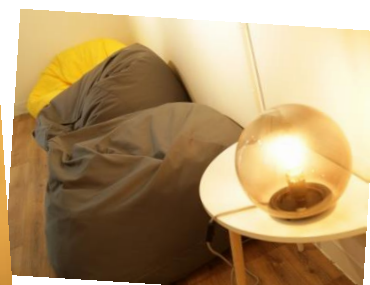
融軒內掛著同學藝術品，設有座椅，在柔和的燈光下是相聚談心的好地方。