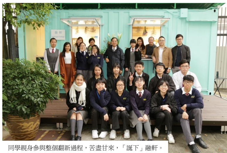
同學親身參與整個翻新過程，苦盡甘來，「誕下」融軒。

「融軒」為「賽馬會創新教師力量」的其中一個項目。去年，本校三位老師入選「賽馬會創新教師力量」成為創新教師夥伴，到訪本地及歐洲不同的創新學校考察，並於本學年獲得賽馬會慈善信託基金撥款，於校內發展一系列課程發展、輔導及藝術項目，以提升學生幸福感。