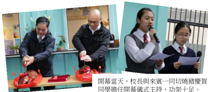
開幕當天，校長與來賓一同切燒豬慶賀。同學擔任開幕儀式主持，功架十足。