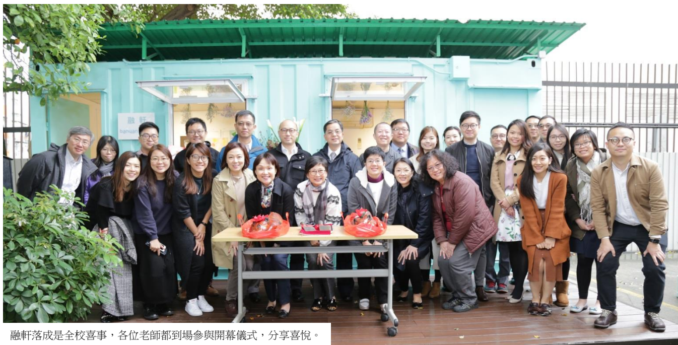
融軒落成是全校喜事，各位老師都到場參與開幕儀式，分享喜悅。

「榕軒」是一個位於校舍榕旁的一所小型貨櫃屋。它曾經是社工的辦公室、貨倉及升學及就業輔導閣。隨着校舍空間重新分配，「榕軒」在經過翻新後，易名為「融軒」。