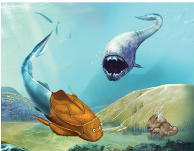
盾皮魚構想圖

地球生命力展覽由香港地質公園及中銀香港慈善基金合辦，主要向同學們介紹地球的誕生、化石的形成與物種的演變。當中藏著許多的世界第一！當中包括最早發展出雙眼的生物三葉蟲、最先懂得浮潛的生物鸚鵡螺以及原始的無脊椎魚類盾皮魚，逐步帶領同學們探索四十六億年前的神秘國，看看不一樣的地球。