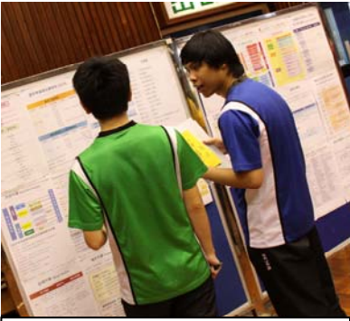
學生根據成績及各課程資訊決定前路