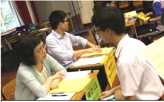
老師根據學生成績，詳細分析其資助學位課程排序選擇