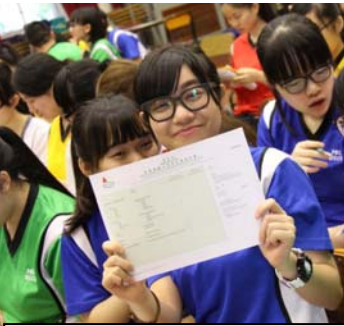
學生收到「文憑試模擬成績單」

升學及就業輔導組與學友社於 5 月 15 日為中六同學舉辦了一個模擬放榜活動。當天中六同學收到一份以他們校內「模擬文憑試」成績編訂的「成績單」，然後便根據自己成績，即場決定自己的前路：報讀資助大學學位課程、副學士或高級文憑課程或就業。學生通過此活動，預先體驗放榜時的真實情況，為真正的文憑試放榜作好預備。