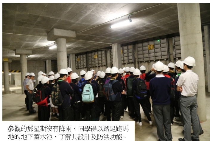
參觀的那星期沒有降雨，同學得以踏足跑馬地的地下蓄水池，了解其設計及防洪功能。

升輔組老師為活動設計了一張工作紙，同學事先在參觀前須先瀏覽渠務署網頁，初步了解其工作，完成工作紙的前半部份。同學參觀期間亦須在工作紙上作記錄，以回答當中問題，最後須撰寫感想及得著以完成整份工作紙。以下為部份同學的得著分享：