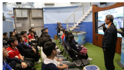
在小蠔灣污水處理廠了解其可再生能源科技的應用。