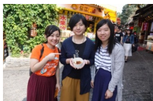
於泉州伊斯蘭文化陳列館欣賞藝術品