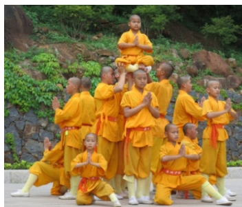
少林寺表演：十八小羅漢各顯神通