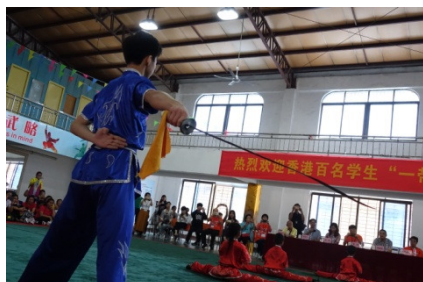
參觀泉州南少林國際學校武術表演