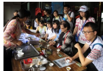
在土樓內品茗，別有一番風味。