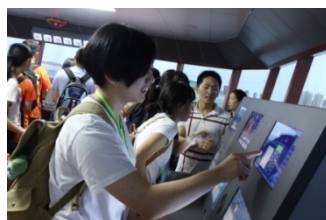
本校同學參觀集美航海學院的「大型船舶操縱模擬器」，閱讀地圖技巧大派用場。