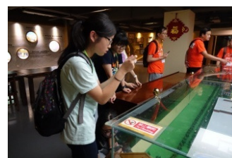
同學於古龍醬文化園內了解醬油釀造過程及中國獎文化