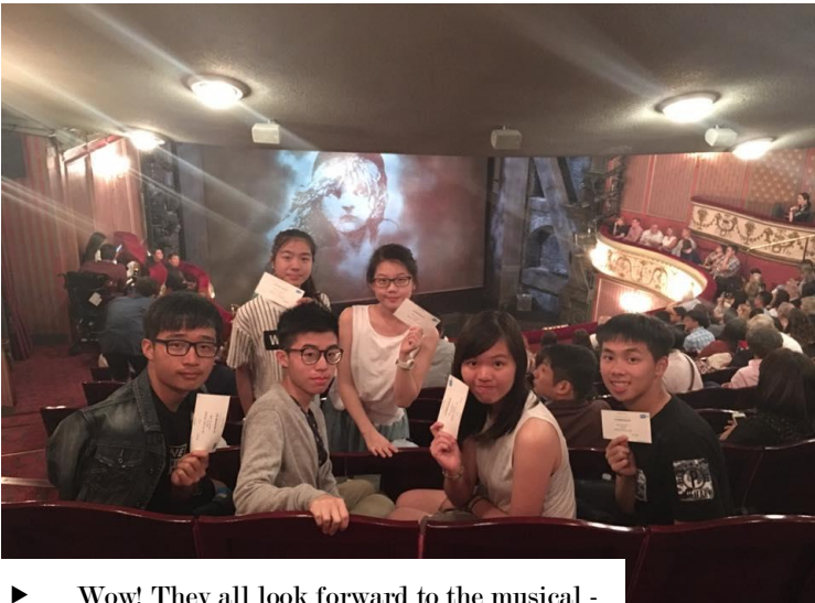
► Wow! They all look forward to the musical - Les Miserable!!