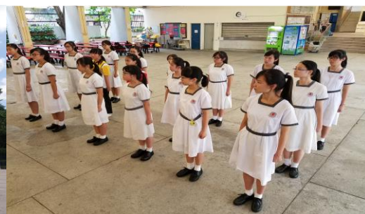
▶ 護士見習支隊練習步操時一絲不苟。