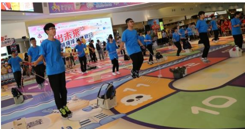
同學動作輕巧，「青春無敵」！

本校校長、老師及 120 名中四同學及 8 名中五學生會內閣成員於上周六 (9 月 16 日) 於荃灣愉景新城參與由金銀業貿易場慈善基金及中國香港跳繩總會合辦的『「跳出未來」慈善接力挑戰日』。當天本校同學與其他近 2,000 名中小學生及市民接力跳繩，場面墟囂，最後創出接力跳繩的香港紀錄，並同場見證各本地運動員再創「10 分鐘跳繩接力打一百個前空翻 145 次」的新世界紀錄。