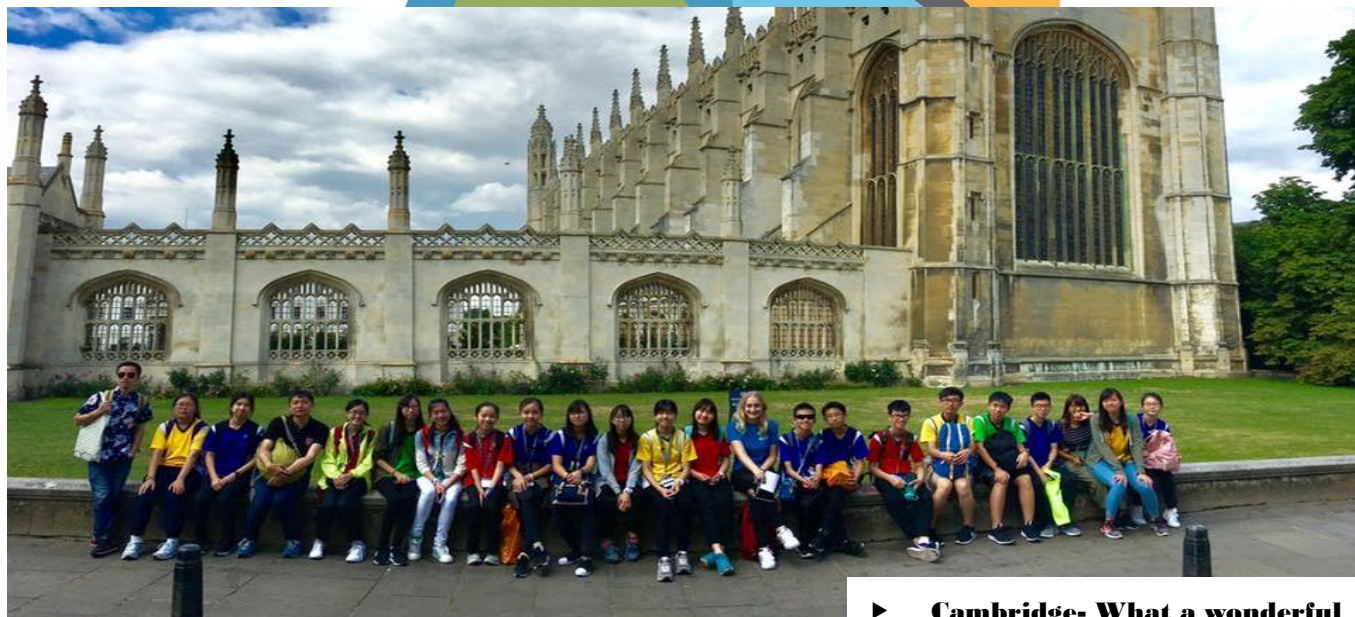
► Cambridge- What a wonderful