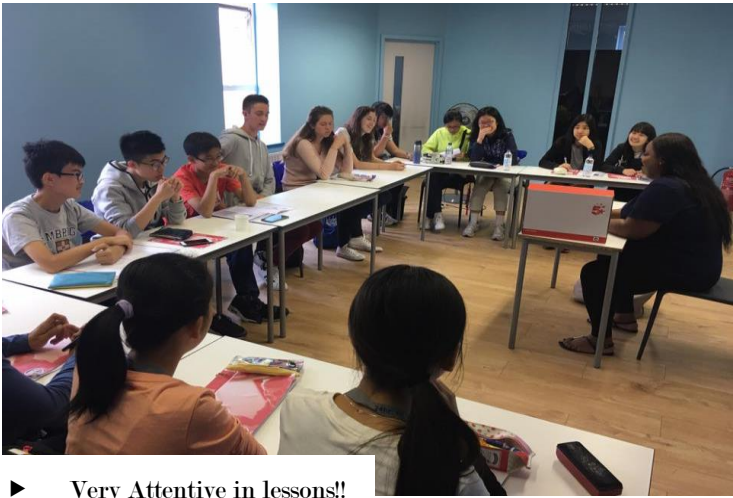
► Very Attentive in lessons!!