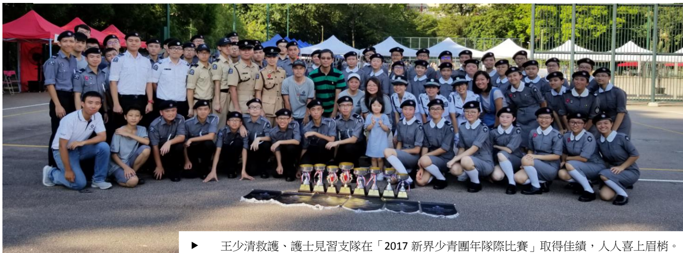
▶ 王少清救護、護士見習支隊在「2017 新界少青團年隊際比賽」取得佳績，人人喜上眉梢。

繼於聖約翰救傷隊新界總區少青團家居護理及急救比賽中連獲兩獎之後，王少清護士見習支隊與救護支隊再下一城，於本月十日假九龍界限街花墟公園球場舉行的制服檢閱及步操比賽勇奪多個獎項，更在新界西第一聯隊四十多支隊中脫穎而出，勇奪聯隊總冠軍，榮獲會長盃。此實有賴隊員長期努力不懈，投入各項社交及實用的技能訓練，並且高度重視合群，具有時刻熱心服務社會的精神。