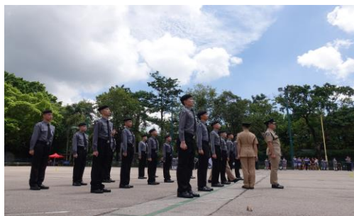
▶ 救護見習支隊精神抖擻地步操。