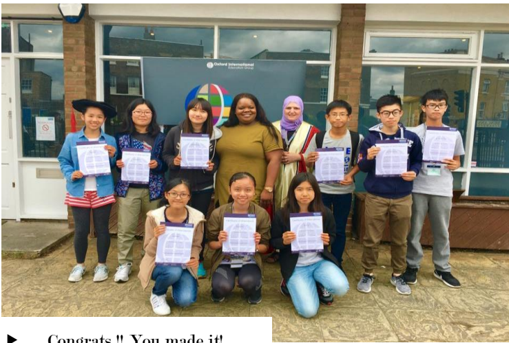
► Congrats !! You made it!