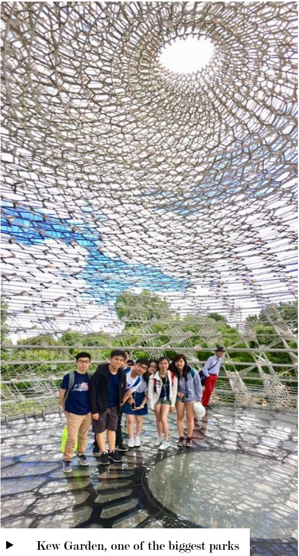
► Kew Garden, one of the biggest parks in the world!!