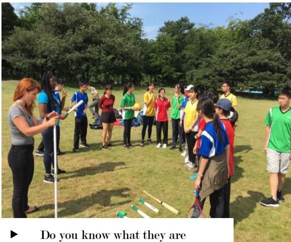
► Do you know what they are learning in sports lessons?