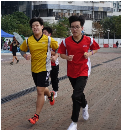
一個急起直追，一個氣定神閒