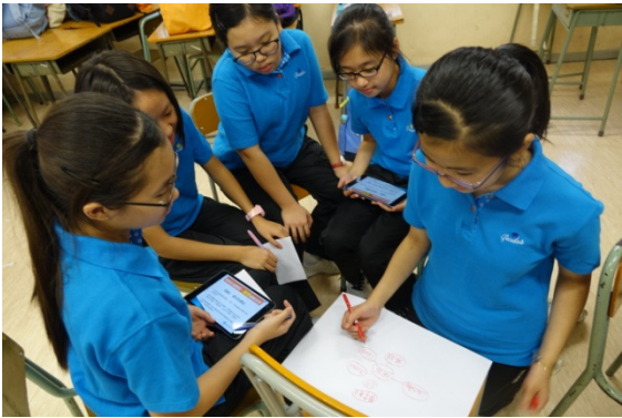
中一新隊員正在進行小組討論，向組員推介「最好的網站」。