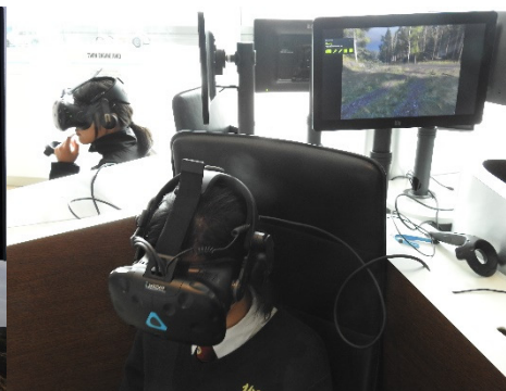
同學試玩擴增實境(AR)教育遊戲