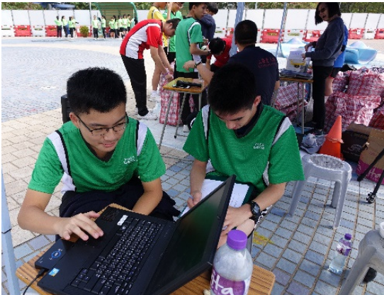
工作人員協助處理參賽同學的資料及紀錄，勞苦功高。