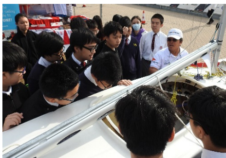
同學們專心聆聽工作人員講解帆船的構造

Volvo Ocean Race 環球帆船賽是世界三大帆船比賽之一，歷時八個月、航程超過四萬五千海里。本屆比賽共有七支參賽船隊，船隊在 2018 年 1 月中旬抵達香港，在維多利亞港內及圍繞港島進行激烈的帆船競技。同時，大會已於啓德跑道公園舉辦一連十五日的帆船嘉年華，而本校中二級同學也在 1 月 24 日上午，來到啓德郵輪碼頭，參觀及了解帆船比賽及嘉年華的運作，內容含有本年度中二級學習元素 STEM (科學 Science、技術 Technology、工程 Engineering 及數學 Mathematics) 教育理念設計，在課堂以外裝備學生的能力，以應對社會乃至全球性的經濟、科學和科技革新。