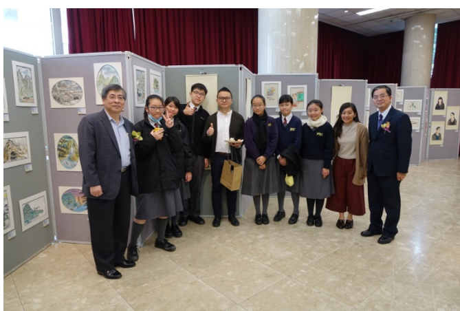
同學觀摩資深藝術家作品，學習傳統中國水墨畫的氣韻。