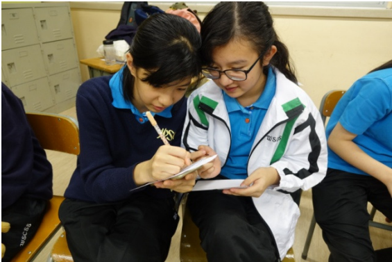
隊員正在進行名為「完美密碼」的活動，學習如何將自己常用的密碼，透過想像力將之改為令人難以撞破的密碼。你能猜出「B@++3rf1Y」代表什麼嗎？