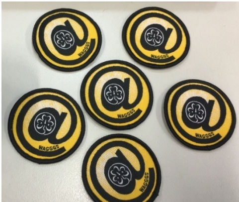
「智 NET 網民獎章」