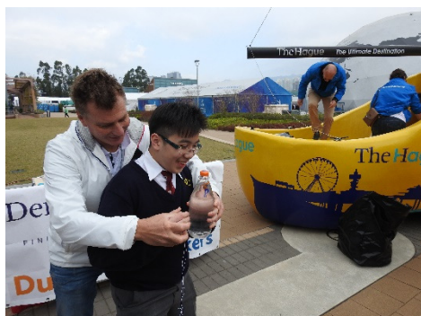
同學在外籍導師帶領下進行氣樽實驗