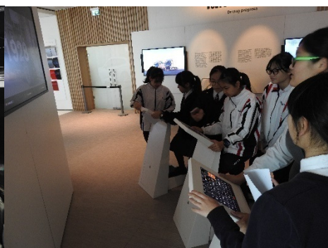
同學合作解決數學遊戲中的難題