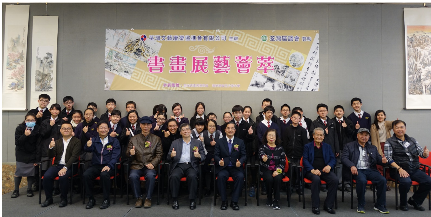
參與開幕禮的同學與嘉賓、校長、老師合照

由荃灣文藝康樂協進會主辦、荃灣區議會贊助的「書畫展藝薈萃」已於2018年1月17日至21日假荃灣大會堂展覽館舉行，寶安商會王少清中學聯同榮光書畫佛易學會為是次展覽的參展團體。本校展出逾100份初中及高中選修視覺藝術科同學的中國書畫作品。作品展示了同學對中國傳統書畫藝術的造詣，亦加入當代藝術創作的手法，展示具創意的中國書畫。