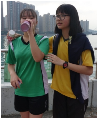
喝口水，跑得更快更遠。