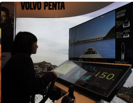
同學在 The Globe 球體影院，感受水手在賽事中 的挑戰。