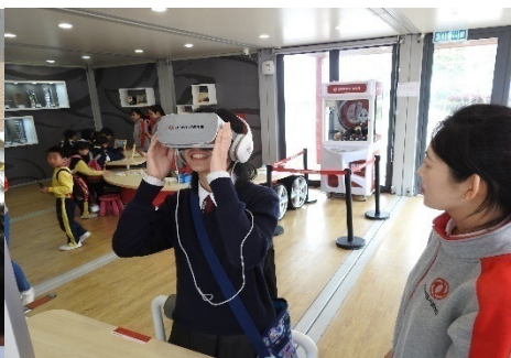
同學戴上 VR 虛擬實景頭盔，興奮不已。