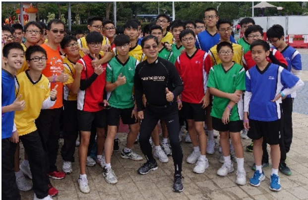
校長一身黑衣勁裝，準備與同學仔一較高下！