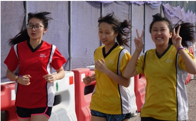
中六同學享受校園生活中最後的校慶長跑，一臉爽快的樣子。