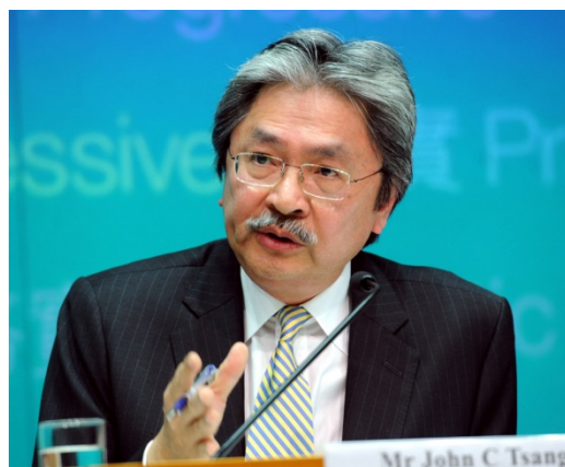
(圖片摘自「大公財經網」)