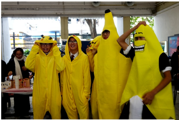
黃色兵團：早買早享受!(畫外音：遲買多折扣!)

少清校園祭，不僅是每年同學們翹首以待的活動，也像一本珍貴的相簿，記載著不少美好的時光，歡欣的成長片段。二月二日下午，各班同學在露天操場和兩天操場擺設不同的攤檔，包括售賣自製小食，手調飲品、即席手繪人像、製作手作小物、攤位遊戲等。全校同學空群而出，有的拿著代用券忙著挑選心頭好，有的穿梭人群中努力叫賣，熱鬧程度媲美「年宵」。而且，各班攤檔總收入的百分之十會撥作慈善用途，使歡樂滿載的少清校園祭更添幾分意義。