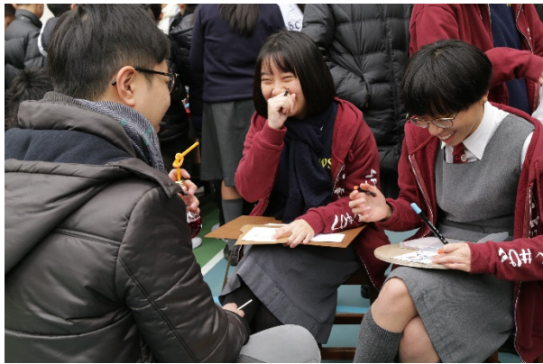
同學，您畫得非常好!