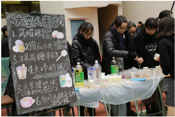
「太空人」美食 -武媚娘、火星撞地球