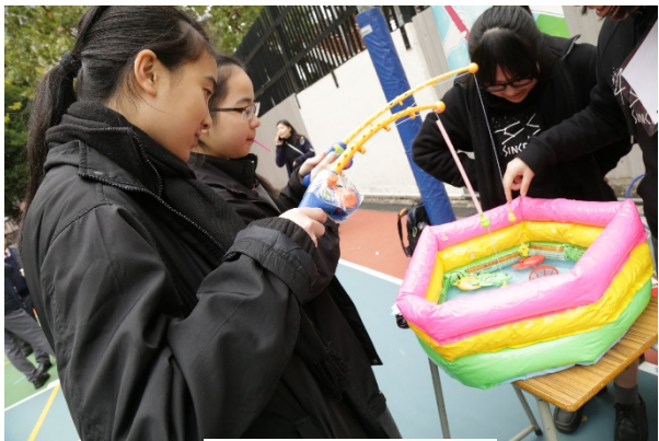
眼力遊戲第一回合