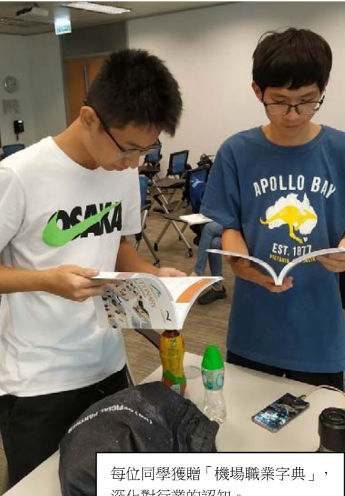
每位同學獲贈「機場職業字典」，深化對行業的認知。

資深機場工作者為同學作講解，讓同學認識機場相關的各個行業、入職條件、晉升機會等，下午則於機場禁區範圍現場視察各職業的工作情況。是次活動參加同學獲賽馬會資助每人 HKD400 課程費，升輔組在此感謝「賽馬會鼓掌・創你程計劃」與香港國際航空學院的資助與課程安排。