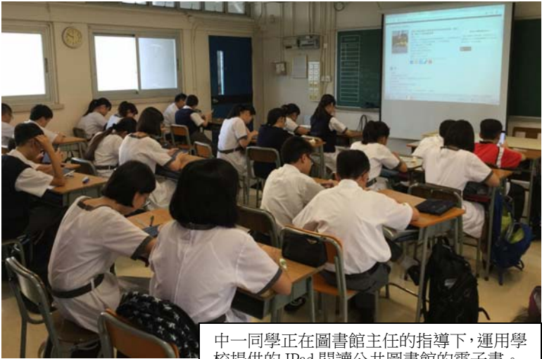
中一同學正在圖書館主任的指導下，運用學校提供的 iPad 閱讀公共圖書館的電子書。

現時政府的公共圖書館網頁，提供了豐富的電子館藏，包括各項中、英文電子書及有聲書館藏，當中包括著名的 Hyread、聯合電子出版(SUEP)、方正中文、遠景繁體、eBooks on EBSCOhost 等。任何市民只要持有圖書證，便可以瀏覽超過 20 萬種書籍或雜誌等電子資料，涵蓋學術文章、商業、技術及社會科學等領域。 電子學習 (E-learning) 是大勢所趨，本校圖書館除了已採購電子書，將會全面推動電子館藏外，亦已透過推廣政府提供的免費電子閱讀資源，培養同學利用流動電子裝置閱讀的習慣。