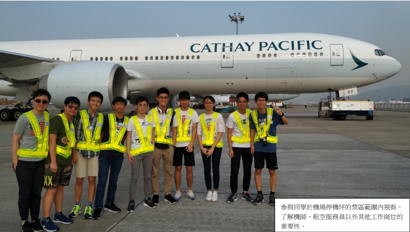
參與同學於機場停機坪的禁區範圍內視察，了解機師、航空服務員以外其他工作崗位的重要性。

本校為「賽馬會鼓掌・創你程計劃」結盟學校，於 2018 年 10 月 27 日獲邀參加香港國際航空學院舉辦的一天課程。香港國際航空學院於 2016 年由香港機場管理局成立，校舍位於香港國際機場，專門為香港航空業培訓專才。參觀當日，學院委派