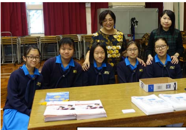
感謝本校女童軍當天為活動服務