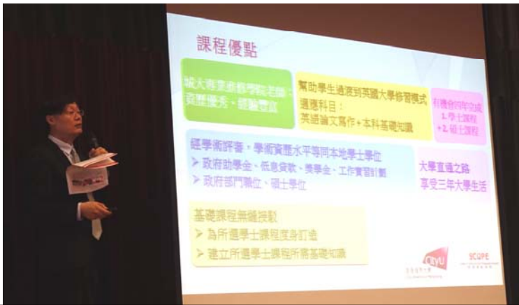
城市大學 SCOPE 負責人為同學講解該學院與多間英國知名大學合辦的英國大學榮譽學士學位課程