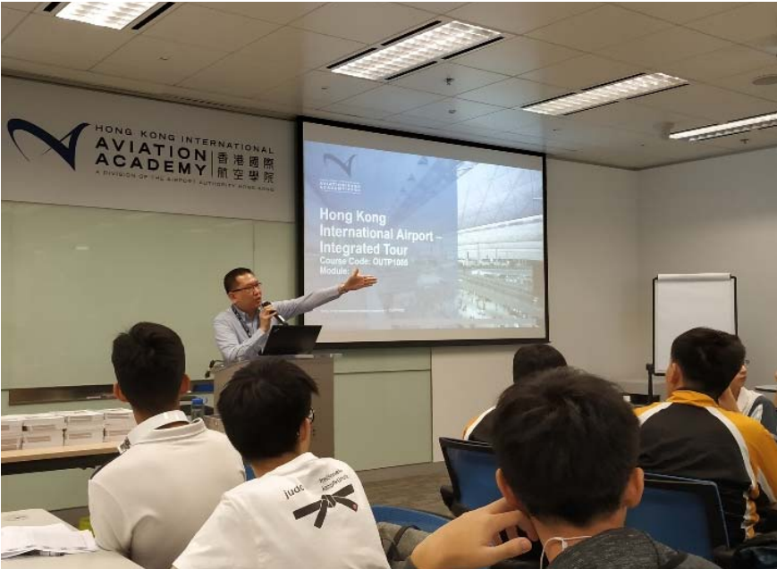
機場工作者介紹香港國際機場