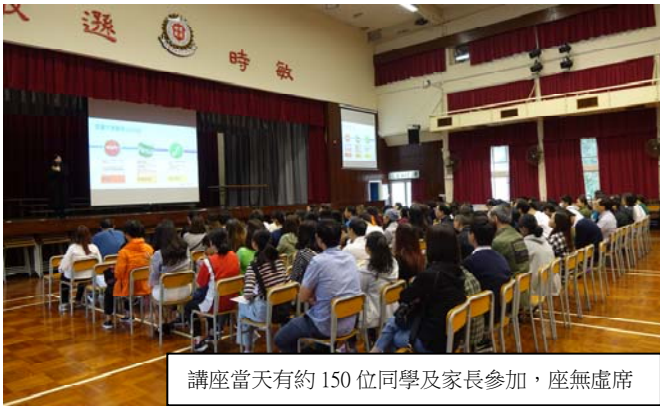
講座當天有約 150 位同學及家長參加，座無虛席

如有興趣了解更多有關海外升學資訊，歡迎同學向譚兆庭老師、黃俊佑老師及徐笑珍老師查詢。