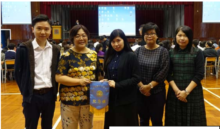
升輔組老師為講者頒贈學校錦旗