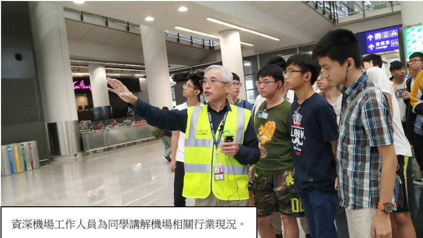
資深機場工作人員為同學講解機場相關行業現況。

本校為「賽馬會鼓掌・創你程計劃」結盟學校，於 2018 年 10 月 27 日獲邀參加香港國際航空學院舉辦的一天課程。香港國際航空學院於 2016 年由香港機場管理局成立，校舍位於香港國際機場，專門為香港航空業培訓專才。參觀當日，學院委派