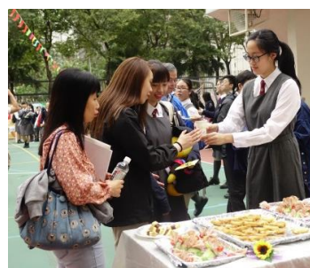
典禮後家長、舊生與中六學生於操場享受茶點，一同敘舊閒談。