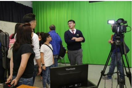
校園電視台：直播現場