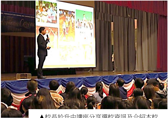
▲校長於升中講座分享選校資訊及介紹本校