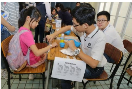
多用途活動場：聖約翰急救示範