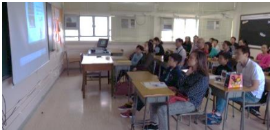
◀講座反應熱烈，禮堂爆滿，臨時安排家長於課室觀看講座直播，三層課室座無虛席。