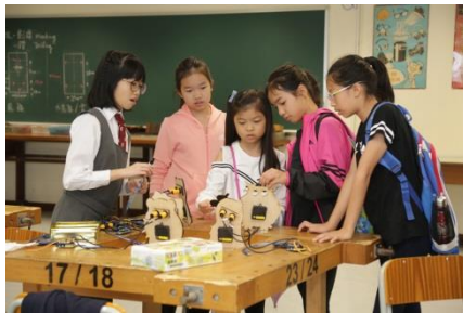
設計與工藝室一學生作品展覽