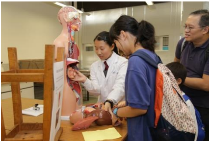
化學實驗室：生物展覽