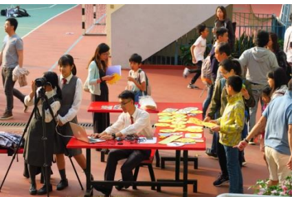
雨天操場：多媒體製作組一即時拍攝紀念照