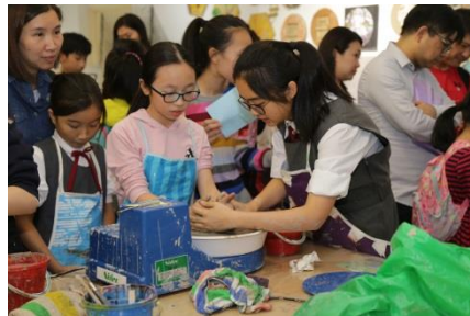
視藝室：陶藝創作體驗