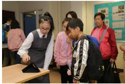
圖書館：電子圖書示範