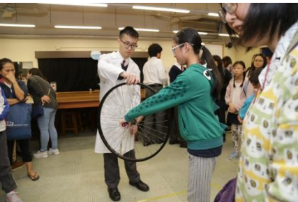
科學實驗室：即場物理實驗 2