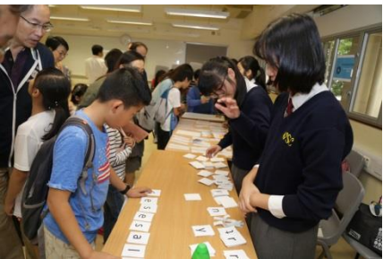
英文室：英文棋盤遊戲