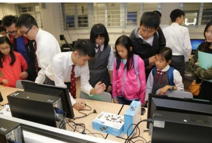
電腦室：機械人編程