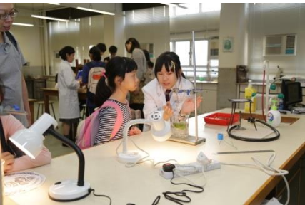
化學實驗室：化學實驗