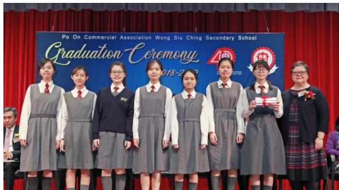
主禮嘉賓葛文林教授 (右一) 向本校畢業生頒授畢業證書

本校藉此群賢畢至的良機，在眾賓客的祝賀及見證下，頒發長期服務獎予多位資深教職員，衷心感謝他們多年來對學校和學生的付出。同場亦頒發多項獎學金予品學兼優的同學，以作鼓勵。當天又安排了學生表演環節，同學盡顯才華。典禮後師生於操場及清園相聚，大談近況敘舊，場面溫馨。