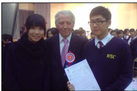
◀ 同學於混聲合唱比賽後與評判合照。