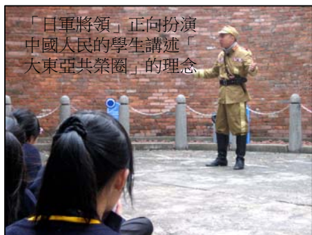
「日軍將領」正向扮演 中國人民的學生講述「 大東亞共榮圈」的理念

環繞博物館的鯉魚門砲台古蹟，化身為一個個舞台場境，重現日佔時期中各色小人物的小故事。我校學生也分飾一角，與劇中角色對話，甚至改變故事發展，並從中