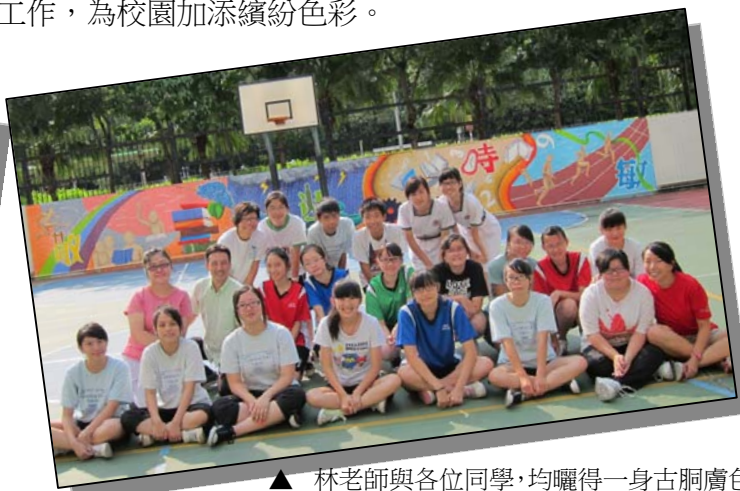
▲ 林老師與各位同學，均曬得一身古銅膚色。