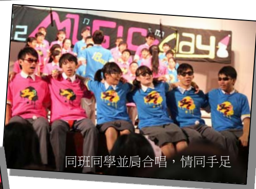
同班同學並肩合唱，情同手足