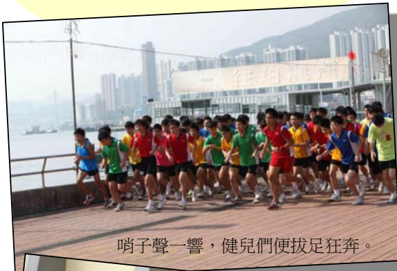
哨子聲一響，健兒們便拔足狂奔。

為鼓勵同學多做運動，強健體魄，鍛鍊意志，本校今年繼續舉辦校慶長跑。當天氣氛熱烈，同學精神抖擻，與大家一起完成長跑。相信當天荃灣西有很多地方都留下了本校同學的足跡。