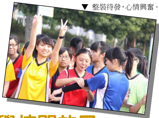
▼ 整裝待發，心情興奮。