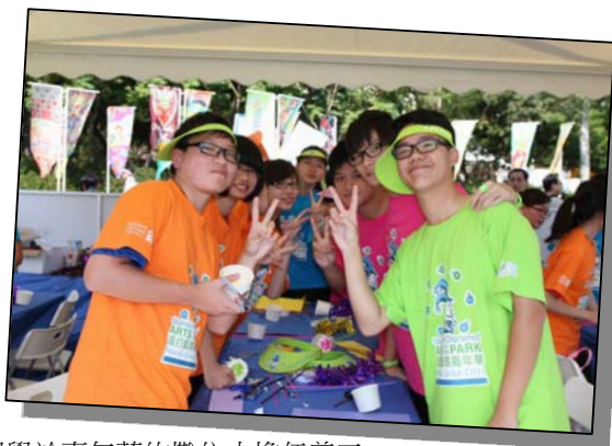
▲ 同學於嘉年華的攤位中擔任義工。

本校多位中四同學在渣打藝趣嘉年華中擔任義工，協助主辦單位—香港青年藝術協會推廣藝術文化。是次活動包括免費的藝術攤位及巡遊等。