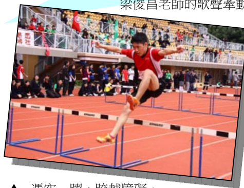
▲ 憑空一躍，跨越障礙。