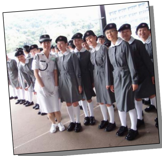
▲ 隊員穿著整齊制服，參加步操比賽。

本校救傷隊一向秉承救急扶危的宗旨，除了為早會、陸運會和家長日當值，亦參加隊際比賽及大會操等校外活動。